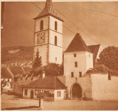
Die befestigte Kirche von Muttenz.