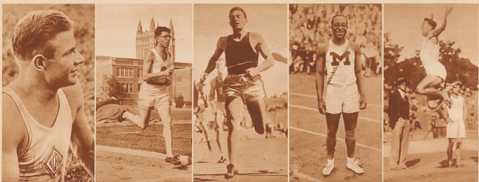
Ein Weltrekord fiel auch im Zahnkampf, in dem der Amerikaner Jim Bausil den erstmaligen Titel von 344,23 Punkten erzielte. Man wird sich dabei vor Augen halten müssen, daß die Punkte auf der Basis der olympischen Rekorde des Jahres 1912 berechnet werden (Ergänzung des Rekorde ergibt ein Total von 1000 Punkten pro Leistung, von 10:00 für sämtliche sechs Leistungen). So daß der olympische Zahnkämpfer aus durchschnittlich in jeder einzelnen Leistung mehr als den sechzigsten olympischen Rekord herauskommen mußte. Einzelne seiner Leistungen waren erheblich über den schwedischen Landesrekord.