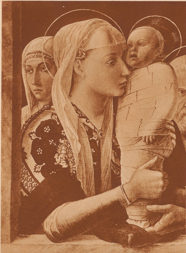
Dieses Christkind zeigt deutlich, wie man die ganz kleinen Kinder zur Zeit, da das Bild gemalt wurde, kleidete: eng umschnürt von schweren Windeln, nicht einmal die Aermchen durften sich bewegen