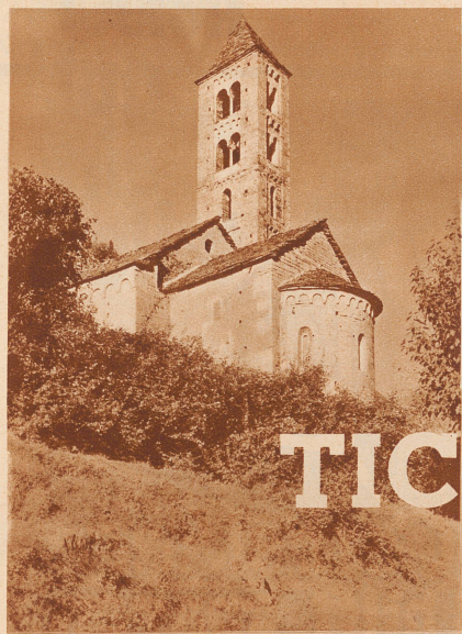
Kirche von Giornico

ALLEINIGE FABRIKANTEN RÜESCH, KUNZ & C IE VORM. R., SOMMERHALDER. BURG AARGAU