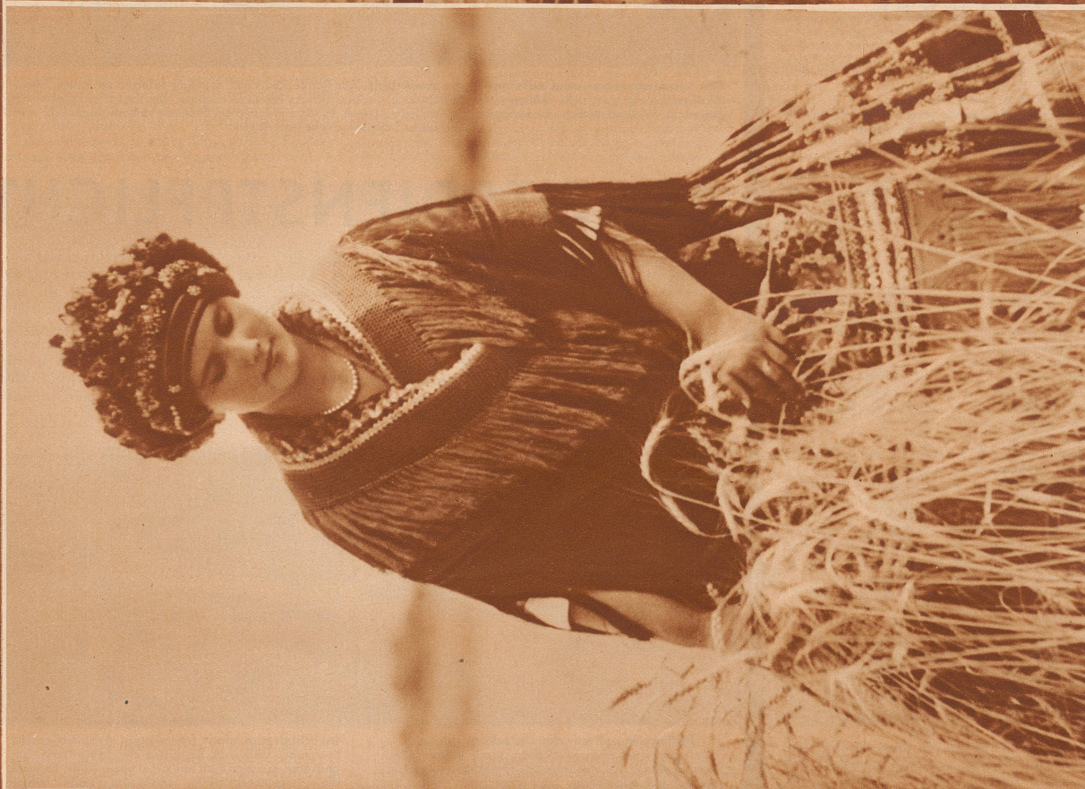
Ungarisches Bauernmädchen Aufnahme Kutschuk