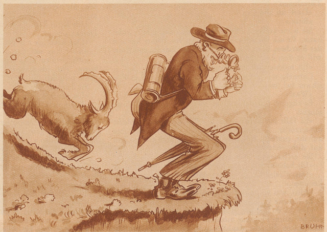
«Ei, sieh da, hier oben ein vierblättriges Kleeblatt! — Wenn das kein Glück bedeutet!»

Schneider: «Ich bin der Schneidermeister, kann ich vielleicht Herrn Schmitt sprechen?» Dienstmädchen: «Ach so, Sie kommen wohl zum Probieren?» Schneider: «Ja, ob ich mein Geld kriege!»