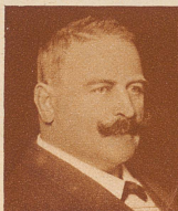
Alt Nationalrat J. Bürgi, Arth starb 88 Jahre alt. 1904 bis 1908 war er Mitglied des schwyzerischen Kantonsrates. 1919 bis 1928 vertrat er die Bauernpartei im Nationalrat. Um die Förderung der Braunviehzucht hat er sich große Verdienste erworben