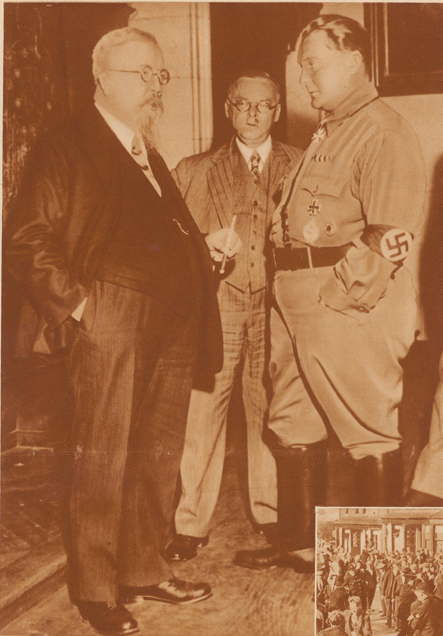
Die neuen Spitzen des Deutschen Reichstags. Reichstagspräsident Göring von den Nationalsozialisten (rechts) im Gespräch mit dem ersten Vizepräsidenten Esser vom Zentrum (links) und dem dritten Vizepräsidenten Rauch (Mitte) von der Bayerischen Volkspartei