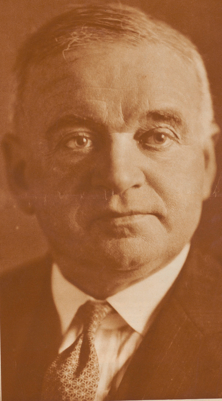
Bild unten: Der Vizepräsident des Kongresses: Prof. Dr. Michel Plancherel, Rektor der Eidg. Tech. Hochschule, geboren in Bussy im Kanton Freiburg am 16. Januar 1885, früher Ordinarius für Mathematik in Freiburg, seit 1920 an der Eidg. Tech. Hochschule. Verfasser zahlreicher mathematischer Abhandlungen

Internationaler Mathematikerkongress in Zürich 4.—12. September 1932