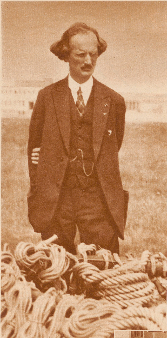
Daß das Professor Piccard ist, wagt man kaum mehr zu sagen, denn jedes Kind, selbst wenn es noch im unbeschwernten Alphabetalter steckt, kennt sein Bild

lung mit Prof. Piccard nur förderlich zu sein, denn immer wieder fühlte sich irgend jemand höchst geschmeichelt, mir beim Ein- und Aussteigen helfen zu dürfen.