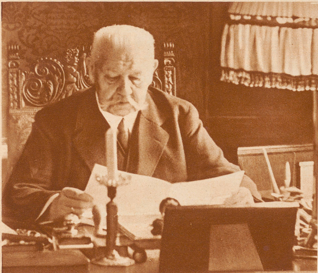
Dies ist Reichspräsident Paul von Hindenburg

Unmittelbar nach dem Stratosphärenflug, als das Bild des kühnen Forschers in allen Zeitungen erschien, hatte ich ein recht bequemes Leben. Neben dem üblichen Korb voll Glaszylinder und Schalen mit gärenden Kirschen und schimmelnden Kartoffeln und derlei Dingen, mit denen ich zur Vorweisung von Schulversuchen zum Nüchternheitsunterricht an die Lehrerkonferenzen zu ziehen pflegte, konnte ich damals noch bequem ein Kofferchen, meine Aktenmappe, eine Rolle mit Wandbildern, einen Regenschirm und ein Paket Schriften mitnehmen. Diese merkwürdige Bepackung schien der Verwech-