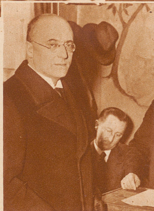
Der ehemalige deutsche Reichskanzler Dr. Brüning