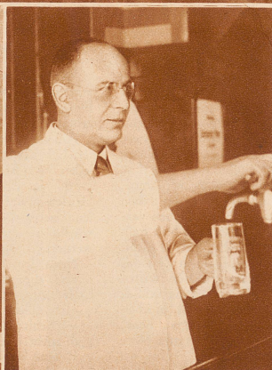
Hier sein Doppelgänger, ein Berliner Schankwirt, dessen Ähnlichkeit mit Brüning wirklich verblüfft. Den größten Unterschied der beiden Köpfe bildet wohl der Ansatz des Ohrläppchens, aber wer schaut einem Menschen zuerst auf das Ohrläppchen?