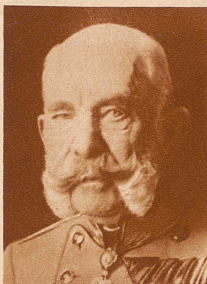
Kaiser Franz Joseph I. von Oesterreich im Greisenalter