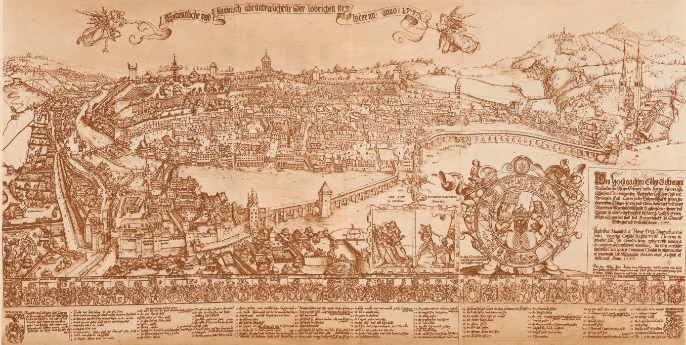
ANSICHT DER STADT LUZERN VON MARTIN MARTINI AUS DEM JAHRE 1597

Das alte Luzern bestand aus zwei getrennten Siedlungen. Im Osten befand sich in erhöhter Lage das selbstständig befestigte Benediktinerkloster St. Leodegar, dessen Anfang auf die Zeit um 700 zurückzuführen. Die Stadt der Reichsleute (die mitemen unter dem Namen des schweizerischen Fürstentums) und dem südlich davon gelegenen Landvogtei an der Eng (auf der rechten Seite). Die östliche und auf höchster Höhe gelegene nördliche «Grossmünster» wurde begrenzt durch das See, die Reuth und den Stadthafen (die heutige Grabenlinie) nördlich der Heisterlinie, die sich von dem alten Stadthafen (bei der Speerebrücke) bis zum Grenzfeld des «Habsburger» vom See über die Kapellbrücke und die heutige Grabenlinie bis zur Kapelle, zwischen der Heisterlinie und der Stadt — beide waren durch die aus dem 13. Jahr