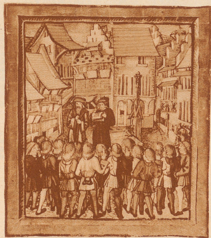
DER BUNDESSCHWUR vom 7. November 1332. Schilling verlegt ihn auf den Fischmarkt. Die Bundesurkunde wurde im alten Rathaus oder auf dem Vorplatz besiegelt. Das Rathaus lag zwischen dem Fischmarkt und der Egg, beim heutigen Hotel «Waage». Die Verteidigung der Bürgerschaft fand eher in der Kapellkirche statt. (Das Bild entstammt der um 1508 verfaßten und mit rund 400 farbigen Miniaturen ausgestatteten Bilderchronik des Luzerners Diebold Schilling)

Der Humanismus findet mit Hans Holbein, der das vornehmste Haus des alten Luzern, das des Jakob von Hertenstein, 1517—19 mit seinen Fresken ausschmückte,