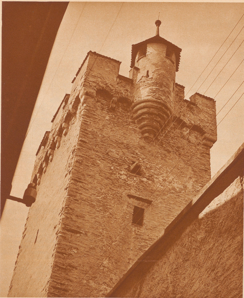
DER «MÄNNLITURM», der wichtigste und schönste von den acht Wachtürmen der ehrwürdigen Luzerner Muesegg-Mauer. Die Stadt hat sich längst über diese uralte Befestigungsanlage hinaus erweitert, die vielbewunderte gotische Mueseggmauer und ihre markanten Türme aber sind unangetastet geblieben. Pietätvoll haben die Luzerner diese Zeugen aus dem Mittelalter aufgespart bis in unsere Tage, wo wir doch ihrer trutzigen Kraft nicht mehr bedürfen. Sie genießen als treue Veteranen aus der Zeit der feindlichen Nachbarn und kriegerischen Angriffe das wohlverdiente Gnadensbrot und hoffentlich so lange als Luzern selbst besteht