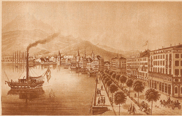
LUZERN um die Mitte des vorigen Jahrhunderts, als es anfangs Mittelpunkt des schweizerischen Fernverkehrs zu werden