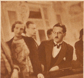
Eine wichtige Persönlichkeit am grünen Tisch ist der «Surveillant» (rechts). Er überwacht sämtliche Vorgänge am Spieltisch und paßt auf, daß alles seinen geregelten Gang geht