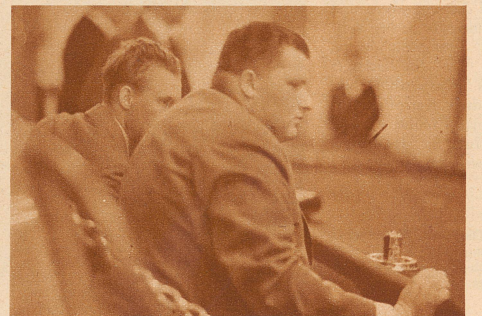
Ganz bei der Sache ist auch dieser ungarische Krösus. Die Verordnung des Bundesrates vom 1. März 1929, daß der Einsatz eines Spielers zwei Franken nicht übersteigen darf, beeinträchtigt die Spannung des leidenschaftlichen Spielers nicht. Bedenken wir, daß sich in 2 Minuten 5 Spielgänge erledigen lassen, dann können wir leicht ausrechnen, daß ein ausdauernder Spieler an einem Spielabend ein hübsches Sümmchen verlieren oder gewinnen kann