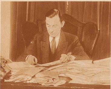
Der Sturz des Bürgermeisters von New York. Jimmy Walker, der populäre Bürgermeister von New York, mußte demissionieren. Man beschuldigt ihn der Bestechlichkeit und der Fahrlässigkeit in Amtsgeschäften. Der Gouverneur des Staates New York hat ein Gerichtsverfahren gegen ihn eingeleitet. Walker, aus kleinen Verhältnissen stammend, war ursprünglich Schlagerdichter, dann Rechtsanwalt und stand nun seit 8 Jahren an der Spitze der 7 Millionenstadt