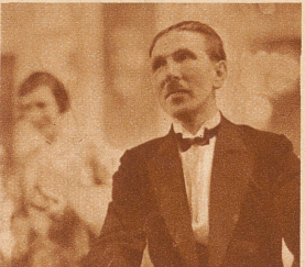
Ein «Croupier», sprachenkundig, anpassungsfähig. Den «Croupiers» ist es streng verboten, für Rechnung der Spieler zu setzen oder überhaupt Geld vorzuschießen