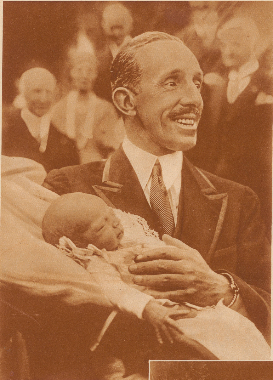
Exkönig Alfons von Spanien als Taufpate. In Wien wurde in Anwesenheit einer großen Anzahl Angehöriger des Hauses Habsburg der Sohn der rumänischen Prinzessin Ileana und Antons von Habsburg aus der Taufe gehoben