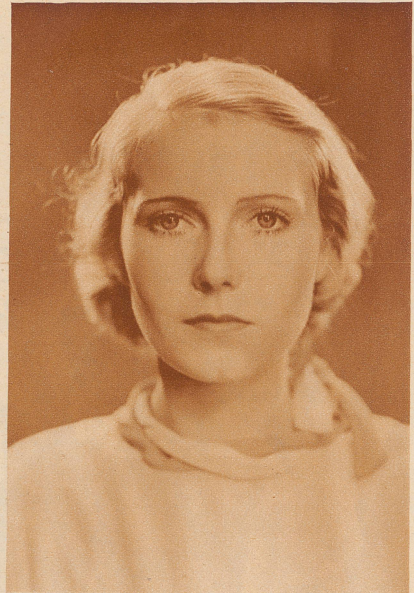
Karin Hardt. Die Hauptdarstellerin des Terra-Filmes «8 Mädels im Boot». Die junge Künstlerin errang sich mit ihrer ersten Filmrolle bei Publikum und Presse einen unbestrittenen Erfolg. Sie wurde auch für eine führende Rolle im Film «An heiligen Wassern» (nach J. C. Heers Roman) verpflichtet