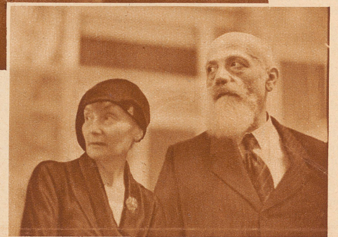
Ein französisches Ehepaar, das sich regelmäßig zum Spiel einfindet und mit Sperberaugen den Lauf der Glückskugel verfolgt