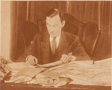
Der Sturz des Bürgermeisters von New York. Jimmy Walker, der populäre Bürgermeister von New York, mußte demissionieren. Man beschuldigt ihn der Bestechlichkeit und der Fahrlässigkeit in Amtsgeschäften. Der Gouverneur des Staates New York hat ein Gerichtsverfahren gegen ihn eingeleitet. Walker, aus kleinen Verhältnissen stammend, war ursprünglich Schlagerdichter, dann Rechtsanwalt und stand nun seit 8 Jahren an der Spitze der 7 Millionenstadt