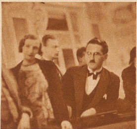
Eine wichtige Persönlichkeit am grünen Tisch ist der «Surveillant» (rechts). Er überwacht sämtliche Vorgänge am Spieltisch und paßt auf, daß alles seinen geregelten Gang geht