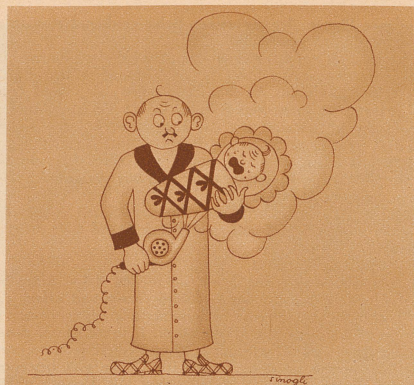
Der erfinderische Ehemann (Bavaria-Verlag)