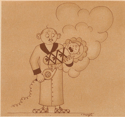
Der erfinderische Ehemann