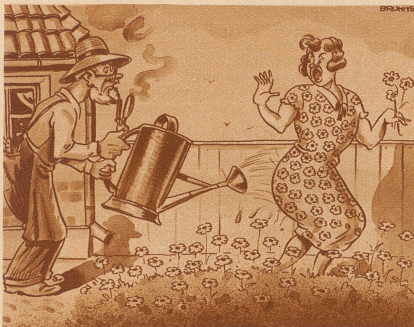
Der kurzsichtige Gärtner

Vor dem Leipziger Hauptbahnhof erlauchte ich folgendes Zwiegespräch: