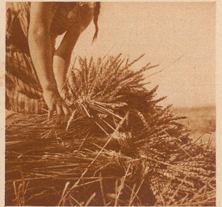
Die Kinder der armen Leute kommen sie auflesen und in Büschel binden. In kurzer Zeit liegen 20 Büschel auf einem Haufen; wenn die Kinder so weiter arbeiten, wird es bald eine Garbe sein

Liebe Kinder, jedes Jahr, wenn auf den Feldern der Weizen und das Korn geerntet wird, gibt es für die Kinder auf dem Lande eine Menge zu tun, eine Arbeit, die nur sie verrichten: die einzelnen Ähren, die nach dem Mähen und Zusammenrechnen noch liegen geblieben sind, sollen doch nicht umkommen. Man würde gar nicht denken, wie viele immer noch dem Rechen entgehen und liegen bleiben; das merkt man erst, wenn man sie aufliest und sie in kleine Büschel bindet. Bei uns in der Schweiz sind es meistens die Kin-