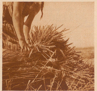
Die Kinder der armen Leute kommen sie auflesen und in Büschel binden. In kurzer Zeit liegen 20 Büschel auf einem Haufen; wenn die Kinder so weiter arbeiten, wird es bald eine Garbe sein

Liebe Kinder, jedes Jahr, wenn auf den Feldern der Weizen und das Korn geerntet wird, gibt es für die Kinder auf dem Lande eine Menge zu tun, eine Arbeit, die nur sie verrichten: die einzelnen Ähren, die nach dem Mähen und Zusammenrechnen noch liegen geblieben sind, sollen doch nicht umkommen. Man würde gar nicht denken, wie viele immer noch dem Rechen entgehen und liegen bleiben; das merkt man erst, wenn man sie aufliest und sie in kleine Büschel bindet. Bei uns in der Schweiz sind es meistens die Kin-