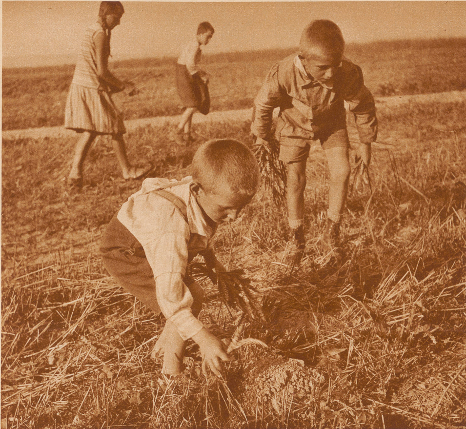
Wenn der Weizen abgeerntet ist, dann liegen noch immer viele Ähren am Boden. Es wäre schade darum, wenn sie von den Vögeln aufgepickt würden