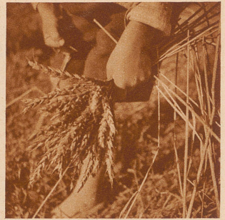
Die Büschel, die der kleine Maxli gerade noch mit einer Hand halten kann, sind kleiner als die der andern