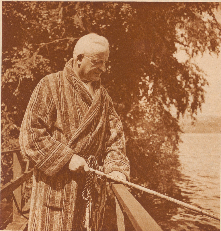
Bundesrat Motta verbrachte seine Ferien in der Kuranstalt Mammern am Bodensee. Wie unser Photograph ihn aufsuchte, da fand er ihn beim Angeln. Wie groß täglich seine Beute war, darüber hat Herr Bundespräsident nicht gesprochen