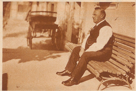
Bundesrat Minger auf seinem Gute in Schüpfen. Es ist nur einer fatalen kleinen Verspätung zuzuschreiben, daß unser Photograph den Kriegsminister nicht auf der Mähmaschine beim Schneiden des letzten Emdgrases knippen konnte