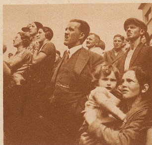
Die Zuschauer. Die Einwohner aller alten Schweizerstädte kennen sich aus in der Geschichte ihrer engern Heimat. Die alten Bauten werden darum mit Liebe betrachtet und geachtet. Auch die Schaffhauser liebten ihren Schwabenturm. Das Bedauern über den Brandfall ist daher allgemein und groß.

Am Vormittag des 22. September 1932 brach im Schwabentor, diesem wuchtigen Turm aus dem Mittelalter, Feuer aus. Eine im Dachstock wohnende Familie konnte im allerletzten Augenblick in Sicherheit gebracht werden. Der Turm brannte vollständig aus. — Der von den Flammen vernichtete Turmaufbau stammte aus dem 18. oder dem beginnenden 19. Jahrhundert. Das Schwabentor selbst jedoch stand schon im 14. Jahrhundert, im Jahre 1370 wird es zum erstenmal urkundlich genannt.