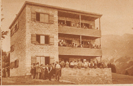
Die neuerstellte Jugendherberge der Genossenschaft der Zürcher Jugendherbergen am Fuße des Stätzerhorns bei Lenzrheide. Das Heim bietet Übernachtungsgelegenheit für 70 Jugendliche und gutausgestattete hygienische Einrichtungen ermöglichen auch längere Aufenthalte, z. B. die Beherbergung von Ferienlagern.