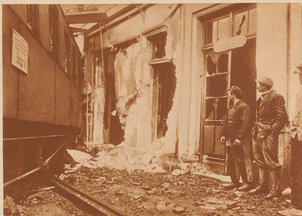
Zugsunfall auf der Strecke Basel-Paris. Am 11. Oktober entgleiste im Bahnhof von Villepattour, auf der Linie Basel-Paris, ein Expreszug. Der Zug fuhr mit 110 km Geschwindigkeit. Zwei Gepäckwagen stürzten um, ein Personenwagen fuhr in den Wartesaal hinein. 16 Passagiere wurden leicht verletzt. Der Materialschaden ist bedeutend. Bild: Das demolierte Stationsgebäude