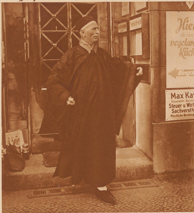
Lincoln-Treibtsch, jetzt der buddhistische Priester Chao Kung, tritt in Berlin aus dem Restaurant, in dem er incognito sein Mittagmahl eingenommen hatte. In diesem Augenblick erkennt ein Photoreporter den berühmten Abenteurer