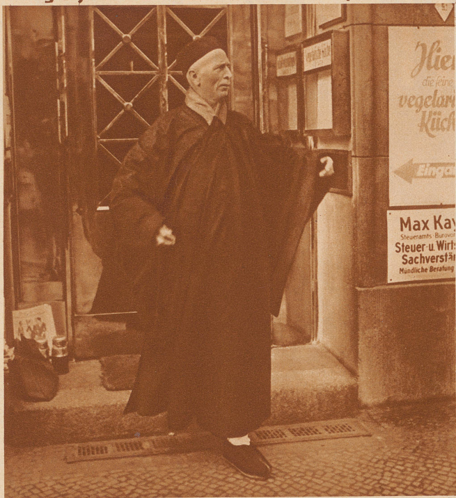
Lincoln-Treibtsch, jetzt der buddhistische Priester Chao Kung, tritt in Berlin aus dem Restaurant, in dem er incognito sein Mittagmahl eingenommen hatte. In diesem Augenblick erkennt ein Photoreporter den berühmten Abenteurer