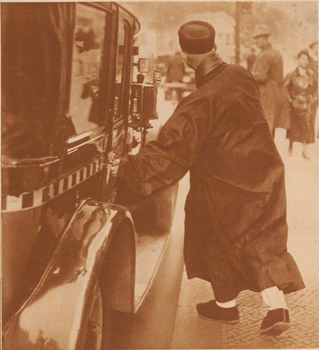
Der Mann, dessen Bilder in sämtlichen Zeitungen Europas unzählige Male erschienen sind, flüchtet vor einem Photoreporter in ein rettendes Taxi

Lincoln-Treibtsch, der große Unruhestifter, eine der mysteriösesten Figuren unserer Zeit, dessen Leben Stoff für zehn Romane gäbe, ist wieder aufgetaucht; diesmal unter dem Namen Chao Kung und in Gewand und Kappe eines buddhistischen Priesters, denn er lebt seit Jahren in einem tibetischen Kloster, wo er, der ungarische Rabbinssohn, zu den höchsten religiösen Weihen aufgestiegen ist, wie Reisende berichten. Nun ist er plötzlich wieder in Berlin, was vielen von böser Vorbedeutung erscheint, denn es gibt kaum eine Revolution der letzten Jahrzehnte, bei der dieser «Sturmvogel Europas» nicht helfend und vorbereitend mitgewirkt hätte. Vorläufig widmet er sich chinesisch-philologischen Studien und hält in der buddhistischen Gemeinde Berlins Vorträge über seine innere Wandlung! In den Straßen der Stadt wurde er trotz seiner fremden Tracht von einem Photoreporter erkannt, der sofort mit seinem Apparat Jagd auf ihn machte, bis sich das Opfer durch Flucht in ein Taxi den Gefahren der Publizität entzog, — aber schon war es zu spät!