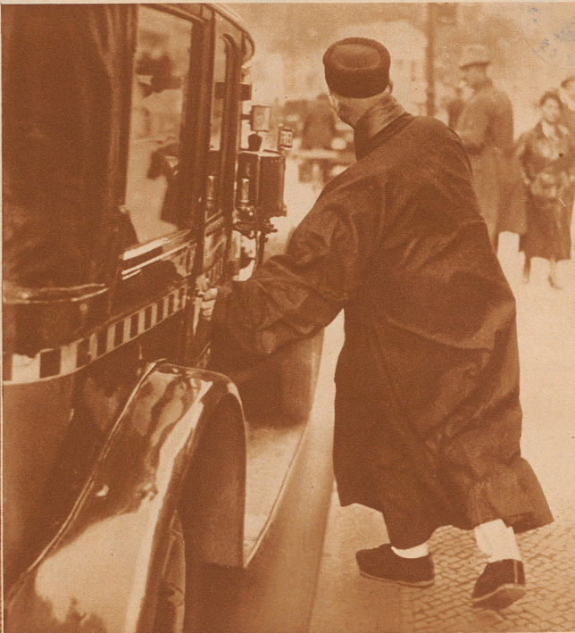
Der Mann, dessen Bilder in sämtlichen Zeitungen Europas unzählige Male erschienen sind, flüchtet vor einem Photoreporter in ein rettendes Taxi

Lincoln-Treibtsch, der große Unruhestifter, eine der mysteriösesten Figuren unserer Zeit, dessen Leben Stoff für zehn Romane gäbe, ist wieder aufgetaucht; diesmal unter dem Namen Chao Kung und in Gewand und Kappe eines buddhistischen Priesters, denn er lebt seit Jahren in einem tibetischen Kloster, wo er, der ungarische Rabbinssohn, zu den höchsten religiösen Weihen aufgestiegen ist, wie Reisende berichten. Nun ist er plötzlich wieder in Berlin, was vielen von böser Vorbedeutung erscheint, denn es gibt kaum eine Revolution der letzten Jahrzehnte, bei der dieser «Sturmvogel Europas» nicht helfend und vorbereitend mitgewirkt hätte. Vorläufig widmet er sich chinesisch-philologischen Studien und hält in der buddhistischen Gemeinde Berlins Vorträge über seine innere Wandlung! In den Straßen der Stadt wurde er trotz seiner fremden Tracht von einem Photoreporter erkannt, der sofort mit seinem Apparat Jagd auf ihn machte, bis sich das Opfer durch Flucht in ein Taxi den Gefahren der Publizität entzog, — aber schon war es zu spät!