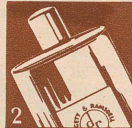
2 Vivatone (in Flaschen)