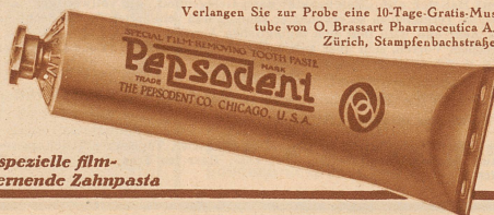
Die spezielle film-entfernende Zahnpasta

Verlangen Sie zur Probe eine 10-Tage-Gratis-Mustertube von O. Brassart Pharmaceutica A.-G., Zürich, Stampfenbachstraße 75.