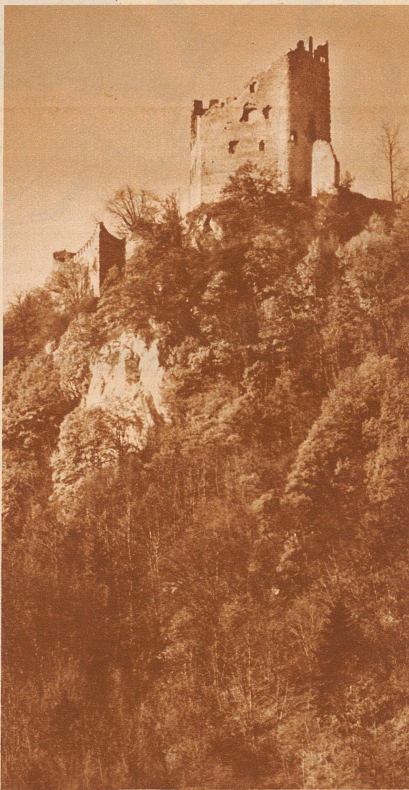
Die Burgruine Pfiffingen

Nein — es wird nicht zu machen sein. Er muß sich wohl oder übel auf eine neue Lüge besinnen, um sich aus der selbstgestellten Falle herauszubringen. Er drehselt kluge Worte zusammen, die ihm freilich schon wäh-