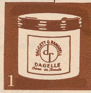
1 Perfect Cold Cream (Topf oder Tube)