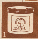
1 Perfect Cold Cream (Topf oder Tube)