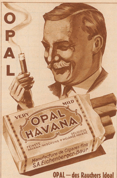
OPAL — des Rauchers Ideal