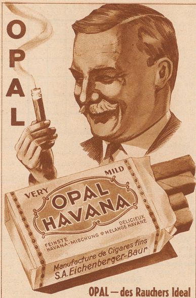
OPAL — des Rauchers Ideal