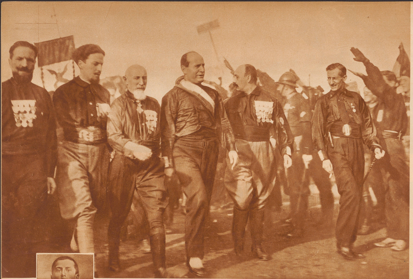
1922: Der Marsch auf Rom. Mussolini an der Spitze seiner schwarzen Armee an dem entscheidenden Punkt der Machtergreifung, dem Marsch auf Rom, 26. - 30. Oktober 1922. An seiner Seite der alte General de Bono und der jetzige Luftfahrtminister Balbo