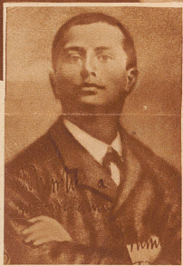
tung kennt man aus mancher hochfiziellen Photographie des Duce

1897: Mussolini 14jährig Das früheste Jugendbild des Mannes, der jetzt über ganz Italien hin so viel abgebildet wird, wie kaum ein Mensch vor ihm. Die energische und gleichzeitig repräsentative Kopfhaltung kennt man aus mancher hochfiziellen Photographie des Duce