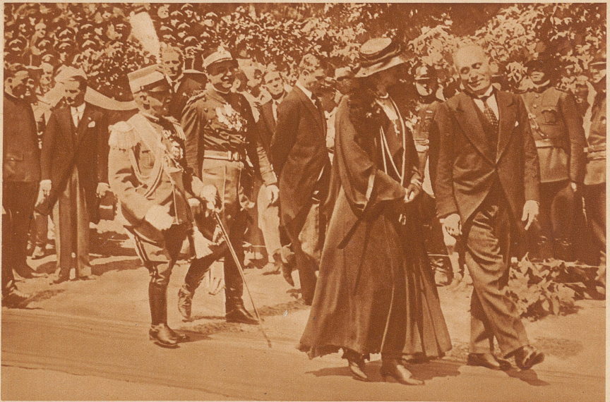
1932: Der Offizielle. Der Diktator Italiens im Gespräch mit der Königin