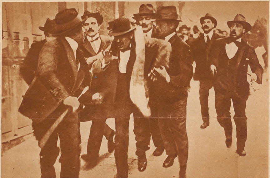
1903: Der Sozialist Mussolini. Der spätere bitterste Feind und Bekämpfer des Sozialismus war von seinen frühen Volksschullehrer-Tagen an, von 1902, selbst Sozialist und blieb es bis zum Ausbruch des Weltkrieges, in dem er im Gegensatz zur sozialistischen Partei für den Eintritt Italiens in den Krieg eintrat. Unsere Aufnahme zeigt die Verhaftung des jungen Sozialisten bei einer Straßendemonstration

Und weiter wird berichtet, wie der Duce mit einigen Politikern in Lausanne den Grand Pont überquerte und dabei bemerkte: Einmal bin ich nicht im Palace-Hotel abgestiegen, sondern habe unter den luftigen Bögen des Grand Pont übernachtet... So ändern sich die Zeiten!