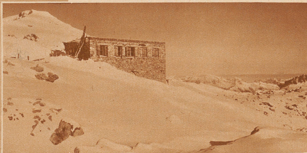
Die werdende Weißfluhhütte im Neuschnee

Wenige Fuß unter dem Gipfel der Weißfluh geht jetzt der Bau von John Lemms Weißfluhhütte der Vollendung entgegen. Zur Eröffnung der Wintersaison wird die Schutzhütte ihre Pforten öffnen. Durch sie wird prächtiges Neuland in dem ausgedehnten, berühmten Tourengebiet von Parsenn erschlossen werden, aber außerdem soll die Hütte auch eine Skischule beherbergen. Die Weißfluhhütte ist 13,5 m lang und 11,5 m breit. Sie ist einstöckig, umfaßt einen Wirtschaftsraum für 80—90 Personen, einen Schlafraum für 25 Personen, zwei Keller, eine Küche und ein Gemach für den Patron John Lemm. Das fehlende Quellwasser wird durch Schneewasser ersetzt. Darum ist hinter Küche und Keller ein 18 000 Liter fassendes Reservoir in die Felsen gesprengt und eine Schmelzvorrichtung mit Filteranlage eingebaut worden. Heizung und Licht erhält das Haus durch Petrolgas. Von der Endstation Weißfluhjoch der Parsennbahn führt ein Saumpfad hinauf zur Hütte, auch für weniger gute Berggänger ist sie mühelos erreichbar. Von der Weißfluh aus genießt man einen herrlichen Rundblick auf das gesamte Meer der Graubündneralpen.