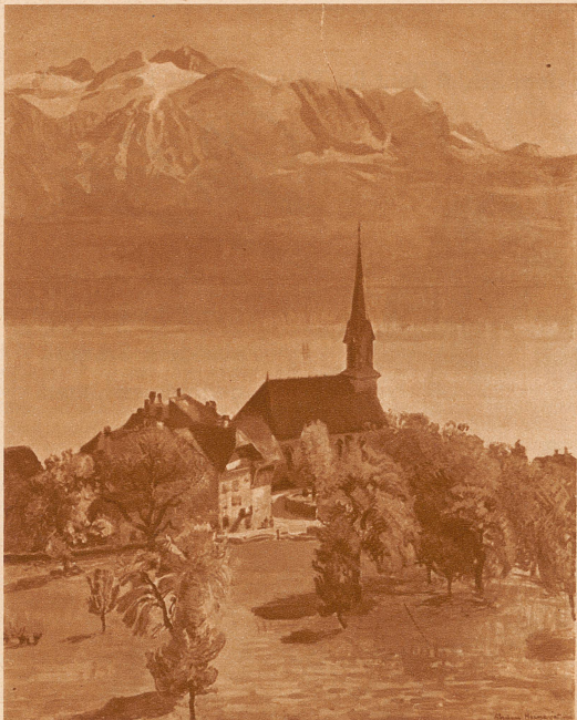
Dorf am Genfersee. Ein besonders reizvolles Landschaftsbild Hermanjats aus dem Jahre 1905. Mit Genehmigung des Besitzers: Kunstsalon Wolfsberg, Zürich

französischen Staat angekauft wurde. In die Schweiz zurückgekehrt, wandte er sich von der erfolgreichen Orientalmalerei ab und änderte seine Schaffensart gänzlich: er wurde Landschaftsmaler, namentlich Maler der Berglandschaft. Seine subtilen, farbig eigenartigen und schönen Werke dieser Zeit, meistens kleinformatige Bilder, werden von allen Kennern besonders geschätzt.