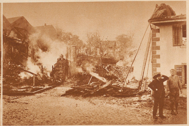
Großfeuer im Solothurnischen Schwarzbubenland. In der Nacht vom 3. zum 4. November sind im Dorfe Nunningen drei zusammengebaute Wohnhäuser samt Scheunen niedergebrannt. Fünf Familien sind obdachlos geworden. Der Gebäudeschaden beläuft sich auf 40 000 Franken. Außerdem blieben große Futtermittelvorräte und das gesamte Mobiliar in den Flammen. — Blick auf die Brandstätte am Morgen nach dem Brande