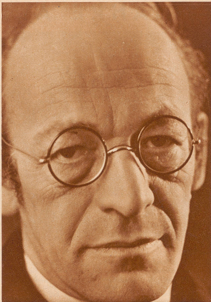
Jakob Bühler fünfzigjährig

Am 8. November wurde der Verfasser des landauf landab bekannten und viel belächelten Mundart-Stückes «Das Volk der Hirten» fünfzigjährig. Es wäre verfehlt, Jakob Bühler einseitig nach diesen spotgesättigten Bühnenbildern zu beurteilen. Seine andern Arbeiten - von «Konrad Sulzers Tagebuch» bis zum jüngst erschienenen Roman «Man kann nichts» - sind leiser und weiser, doch verleugnen auch sie nicht ihren Schöpfer, der Welt und Menschen durch eine scharf geschliffene kritische Brille betrachtet und dem die Rüge näher liegt als das Lob