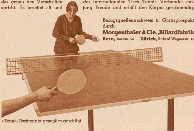
«Tena»-Tischtennis gesehlich geschützt

das genau den Vorschriften des Internationalen Tisch-Tennis-Verbandes entspricht. Es bereitet alt und des Internationalen Tisch-Tennis-Verbandes entgegen Freude und erhält den Körper geschmeidig.