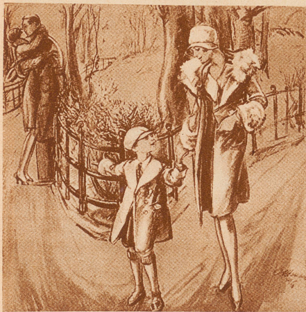
«Sieh mal, Mutti, — ein Film!» (Life)

«Du hattest doch mit der Tochter deines Wirtes ein kleines Techtelmechtel, ist wohl der Vater dazwischengekommen?» «Nicht dazwischen, sondern dahinter!»