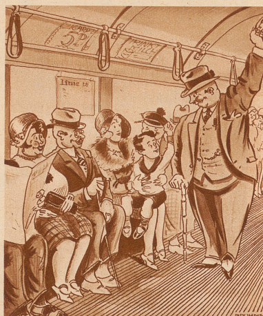
«Darj ich Ihnen meinen Platz anbieten»