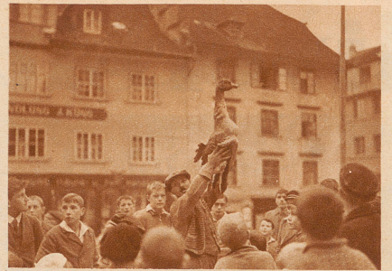
Ein Draht wird über die Straße gespannt und daran die tote Martinigans aufgehängt. Diesmal ist es eine buntscheckige, während man sonst immer eine schneeweiße nahm

eine tote. Die Polizei, die auch dabei sein wollte, sperrte den Platz ab, damit kein Auto in die vielen, vielen Kinder und in die tote Gans fuhr. Plötzlich widerhallte das Städtchen von Trommelwirbeln. Die Kinder jauchzten: «Sie kommen, sie kommen!» Und wirklich, was ist das auch für ein Bögg zwischen den beiden roten Trommlern? Er hat eine riesige Sonnenlarve über den Kopf gestülpt und schwingt einen krummen Säbel in der Faust. Wehe dir Gans! Jetzt geht es dir an den Krage! Aber nicht so rasch! Dem grausamen Mann mit dem Säbel haben sie die Augen verbunden. Und nun wirbeln sie ihn auch noch zwei-, dreimal herum, bis er endlich auf den Draht stößt und mit einem Hieb die Gans vom Draht haut. Aber das geht auch nicht so leicht. Die Gans ist zäh und der Krummsäbel haut nicht. Drei, vier, fünf