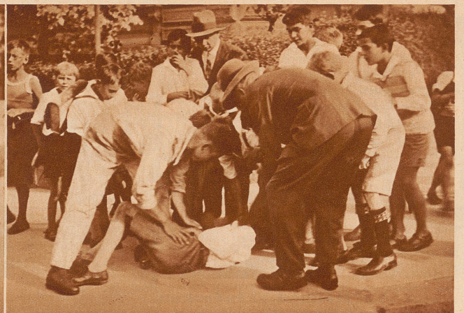
— — — leisten ihm die erste Hilfe, bis der Arzt kommt, um festzustellen, ob der Arme ins Krankenhaus muß oder ob es nur äußere Verletzungen gegeben hat