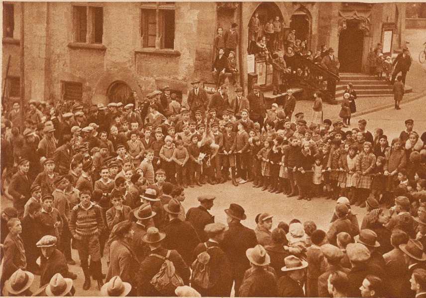
Während der «Gans-Abehauer» mit verbundenen Augen durch das Städtchen irrt, stehen die Kinder ungeduldig wartend um die Gans

Liebe Kinder, der Unggle Redakter hat wieder einmal ein Reischen gemacht, um euch einige interessante Bilder mitzubringen. Am liebsten hätte er einen ganzen Haufen Kinder, alle Leser der Kindersseite mitgenommen. Denn, selber dabei sein, ist immer schöner, als nur die Bilder davon zu sehen, nicht wahr? Nun also, euer Unggle ist die letzte Woche nach Sursee an den Sempachersee gefahren. Bloß wegen einer Gans! Ihr werdet lachen. Gänse gibt's doch überall, da muß man nicht extra mit der Eisenbahn hinreisen. In Sursee war aber etwas besonderes mit einer Martinigans los. Ihr wißt vielleicht, daß man an vielen Orten an Martini, am Namenstag Martins, Gänsebraten ißt. Ein böser Tag für die armen Schnatteriche! In Sursee ist nun ein Brauch mit diesem Gänse-Essen verbunden, den schon die Urgroßväter und -Mütter der Surseer Kinder gekannt haben. Und das ist doch gewiß schon lange her. — Als der Unggle Redakter glücklich und neugierig auf dem Rathausplatz in Sursee stand, da spannten sie gerade einen Draht über die Straße und hängten eine fette Gans daran, keine lebende, sondern