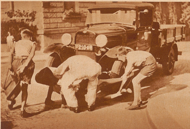
Ist etwas passiert? Ja, ein Knabe hat beim Überqueren der Straße nach der falschen Seite gesehen und ist unter ein Auto geraten. Vorübergehende und der Autoführer holen ihn schnell unter dem Wagen hervor und — —