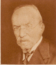
Rechtsanwalt Germano Bruni Bellinzona starb 82jährig an den Folgen eines Sturzes. Er gehörte 1893 bis 1906 dem Nationalrat an, war 1895 bis 1899 Tessiner Staatsanwalt, 1911 bis 1922 Strafgerichtspräsident und einer der hervorragendsten Führer der Tessiner Radikalen