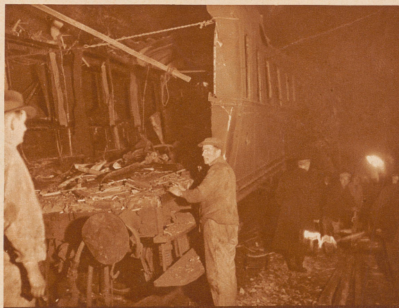
Der Gotthardzug von hinten nach vorn gesehen. Das freie Geleise liegt zur Rechten. Ein Gepäckwagen hatte sich von rückwärts in den Personenwagen hineingeschoben. Er ist bereits abgeschleppt worden