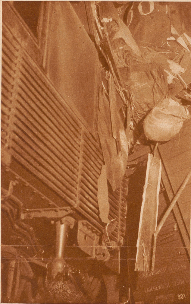
Die Gotthardlokomotive und der darauffolgende Schutzwagen, der Wagen also, der immer zwischen Lokomotive und erstem Personenwagen bei jedem Zug eingeschaltet wird