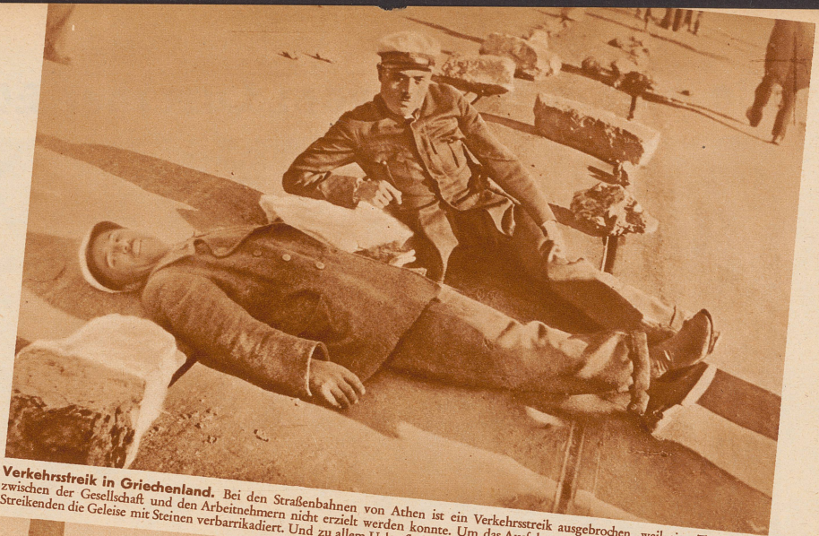
Verkehrsstreik in Griechenland. Bei den Straßenbahnen von Athen ist ein Verkehrsstreik ausgebrochen, weil eine Tarifeinigung zwischen der Gesellschaft und den Arbeitnehmern nicht erzielt werden konnte. Um das Ausfahren der Wagen zu verhindern, haben die Streikenden die Geleise mit Steinen verbarrikiert. Und zu allem Ueberfluß legen sich die streikenden Trämmer noch selbst auf die Schienen

Schwere Explosionskatastrophe in Rathenow bei Berlin. In der Kunstseidenfabrik der J. G. Farben in Premnitz bei Rathenow ereignete sich am 7. Dezember eine Explosion, die 11 Todesopfer forderte. Die Katastrophe ist darauf zurückzuführen, daß zwei Lehrlinge eine Sauerstoff-Flasche fallen ließen. Diese Flasche explodierte und verursachte eine zweite, mächtigere Explosion. Bild: Arbeiter warten vor dem zerstörten Werk auf Nachrichten von den Versicherten