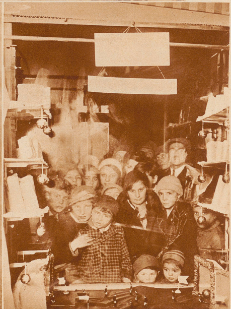
in Wien: Der berühmte österreichische Torwächter Hiden betreibt eine Bäckerei in Wien. Seine Frau baute anlässlich des Länderkampfes das Spielfeld mit den Toren in ihrem Schaufenster auf und sobald sie durch das Radio erfuhr, daß ein Tor geschossen wurde, flog ein kleines Brot in eines der Tore. Dicht gedrängt stand die junge Generation vor dem Fenster, um die Entwicklung der Angelegenheit zu verfolgen. Der Fußball ist Oesterreichs Nationalspiel; in Wien herrscht große Trauer über die Niederlage der heimatischen Helden