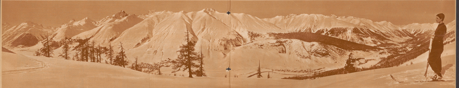
Landschaft im Winterkleid — Landschaft im Sommerkleid Blick von der Alp «Il Nüks» am Südosthang über Zoos auf das lant. Gass links im Bild das Dörfchen Pont, der Ausgangspunkt des Abhanges, in der Mitte des Bildes Zoos, rechts Saas. Die höchste Spitze im Panorama links von Zoos ist der Pt. Kesch, 3420 Meter über Meer