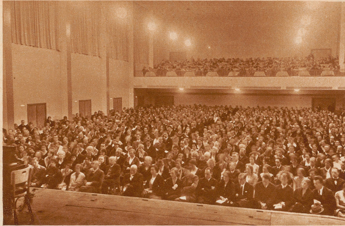
1300 Besucher beim ersten Jecklin-Konzert in Zürich. Das Verlangen nach guter Musik wird auch durch eine Zeit, die als kunstfremd und kunstfern geschmäht wird, nicht ausgetilgt. Die mancherlei Arten künstlicher Musikwiedergabe (Grammophon, Radio, Tonfilm) halten gewiß Viele vom Konzertsaal fern, wecken und mehren dafür bei vielen andern Sinn und Verständnis für die Tonkunst. Möglicherweise liegt ein Hauptgrund für den bedauerlichen Rückgang des Konzertbesuches in den oft überzetzten Eintrittspreisen. Die drei Jecklin-Konzerte dieses Winters stellen einen Versuch auf der Grundlage populärer Preise (Fr. 1.— bis 2.—) dar. Der große Saal des «Limmathauses» war anlässlich des Walter Gieseking-Abends ausverkauft. Im Februar findet am selben Ort ein Solisten-Abend von Stefi Geyer und im März ein Kammermusik-Abend von Elly Ney statt, für welche Veranstaltungen die Nachfrage bereits eingesetzt hat. Der Beweis, daß mit den Jecklin-Konzerten einem vorhandenen starken Bedürfnis Genüge geschieht, scheint erbracht zu sein

Was an der Prospektor-Tätigkeit dran ist, weiß er längst. Ein Dreck ist dran! Der gute alte Tayne in New York ist ein Idiot! Hier und da stößt wohl mal ein Glückspilz auf ein Erzlager oder eine Goldader. Wenn schon. Das geschieht selten und meist gerade denjenigen, die keine Ahnung vom Work haben, Greenhorns, die sozusagen über einen Claim fallen. Mordsglück. Aber ein Esel, wer jahrelang dieser Chance nach-