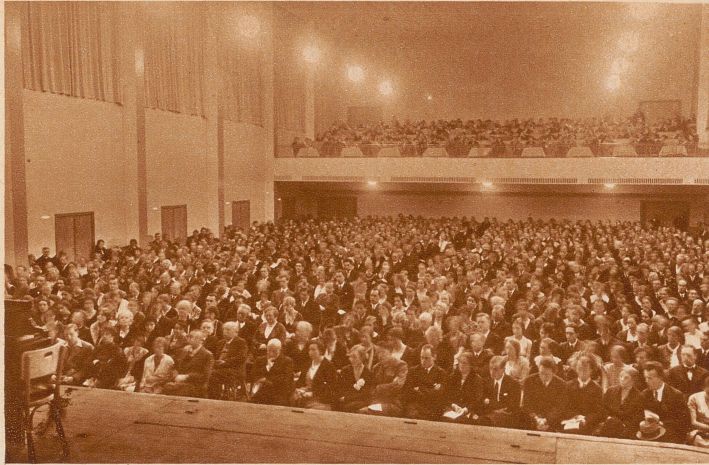
1300 Besucher beim ersten Jecklin-Konzert in Zürich. Das Verlangen nach guter Musik wird auch durch eine Zeit, die als kunstfremd und kunstfern geschmäht wird, nicht ausgetilgt. Die mancherlei Arten künstlicher Musikwiedergabe (Grammophon, Radio, Tonfilm) halten gewiß Viele vom Konzertsaal fern, wecken und mehren dafür bei vielen andern Sinn und Verständnis für die Tonkunst. Möglicherweise liegt ein Hauptgrund für den bedauerlichen Rückgang des Konzertbesuches in den oft überzetzten Eintrittspreisen. Die drei Jecklin-Konzerte dieses Winters stellen einen Versuch auf der Grundlage populärer Preise (Fr. 1.— bis 2.—) dar. Der große Saal des «Limmathauses» war anlässlich des Walter Gieseking-Abends ausverkauft. Im Februar findet am selben Ort ein Solisten-Abend von Stefi Geyer und im März ein Kammermusik-Abend von Elly Ney statt, für welche Veranstaltungen die Nachfrage bereits eingesetzt hat. Der Beweis, daß mit den Jecklin-Konzerten einem vorhandenen starken Bedürfnis Genüge geschieht, scheint erbracht zu sein.

Was an der Prospektor-Tätigkeit dran ist, weiß er längst. Ein Dreck ist dran! Der gute alte Tayne in New York ist ein Idiot! Hier und da stößt wohl mal ein Glückspilz auf ein Erzlager oder eine Goldader. Wenn schon. Das geschieht selten und meist gerade denjenigen, die keine Ahnung vom Work haben, Greenhorns, die sozusagen über einen Claim fallen. Mordsglück. Aber ein Esel, wer jahrelang dieser Chance nach-