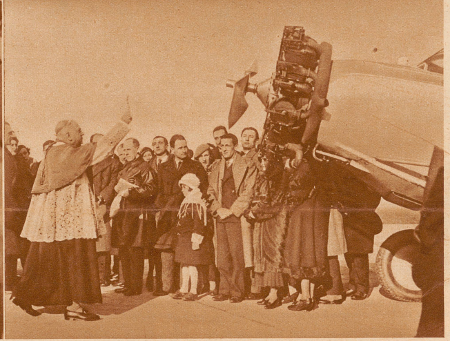
Der Segen für das Flugzeug. Bevor die beiden Langstreckenflieger Réginence und Lenier zum Fluge nach Madagaskar starteten, erhielt die Maschine auf dem Flugplatz von Orly den kirchlichen Segen durch Monseigneur Crepin, Bischof von Paris