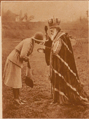
Segnung der Pfadfinderinnenführerin. Anlässlich einer großen Pfadfinderinnen-Zusammenkunft in Bukarest erhielt die Prinzessin Ileana von Rumänien in ihrer Eigenschaft als Ehrenmitglied rumänischer Pfadfinder nach griechisch-orthodoxem Ritus den Segen der Kirche