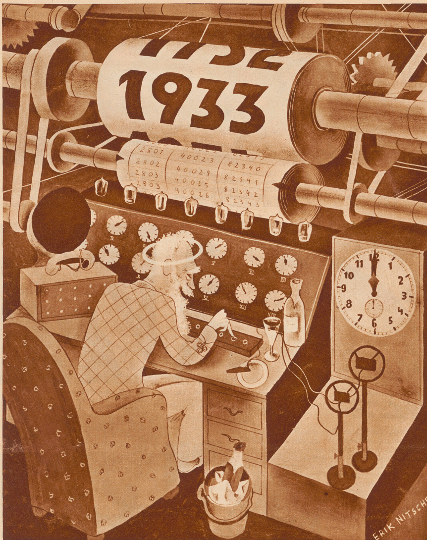
Der große Moment