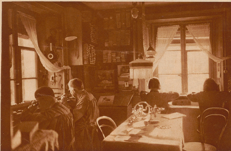
Die Kleinmeister des Berner Jura richten ihre Werkstätten häufig in ihren Wohnstuben ein. Dieser Meister bildet mit seinen zwei Töchtern und einem Sohn eine Arbeitsgemeinschaft. Das Familienoberhaupt belohnt die volljährigen Kinder wie fremde Arbeiter. Solch kleine Familienbetriebe auf dem Lande können sich noch am ehesten über Wasser halten

Wenn von «Uhrenindustrie» die Rede ist, dann stellen wir uns meistens Fabrikbetriebe vor, worin vor der Krisenzeit Arbeiter in großer Zahl Beschäftigung fanden. Nun sind aber von den im Jahre 1929 gezählten 2416 Unternehmungen der schweizerischen Uhrenindustrie ganze 1300 Kleinmeister- oder Heimbetriebe, die höchstens 15 bis 20 Arbeiter beschäftigen und deren Inhaber neben ihren Arbeitern am Arbeitstisch sitzen und selbst mit Hand anlegen. Diese Kleinmeister besonders bekommen die Krise zu spüren, denn einerseits wurde ihnen durch die notwendig gewordene Einschränkung der Schablonausfuhr die Arbeit gestoppt, andererseits aber erhalten sie als Arbeitgeber keine Arbeitslosenunterstützung. So sahen sich viele genötigt, ihren Beruf aufzugeben und sich