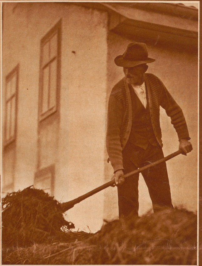
Kleinmeister X mit der Mistgabel