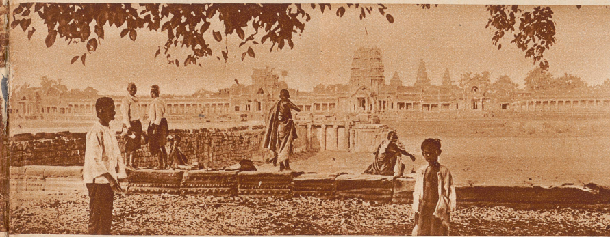
Gesamtansicht des Tempels von Angkor-Wat, vom Westufer des Kanals aus gesehen. In der Mitte der Haupteingang, die Königspforte

Nun sind die wichtigsten dieser Bauten dem Dschungel wieder entrissen worden. Mit großen Kosten hat die Regierung von Indochina die Restaurierung durchführen lassen, und zahllose Besucher aus aller Welt wandern nun jährlich durch die Paläste und Tempel, die vor tausend Jahren von Königen, Priestern und schönen Haremsdamen bewohnt waren.