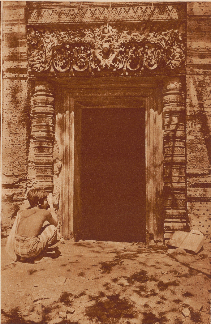
Reichverziertes Portal am einstigen Wassertempel Me-Bon, der im Jahr 950 erbaut worden sein soll

lern jahrzehntelang gearbeitet haben, denn jeder Stein, jede Säule, jede Wand ist mit kunstvoller Ornamentik oder mit Darstellungen aus den altindischen Sagen verziert. Die drei übereinanderliegenden Terrassen sind durch steile Treppen verbunden. Dem gewöhnlichen Volke war nur die Galerie, welche um die erste Treppe führt, zugänglich, Priester und Höflinge hatten Zutritt zur zweiten, der König allein begab sich auf die dritte, wo er vor dem Allerheiligsten seine Gebete sprach.