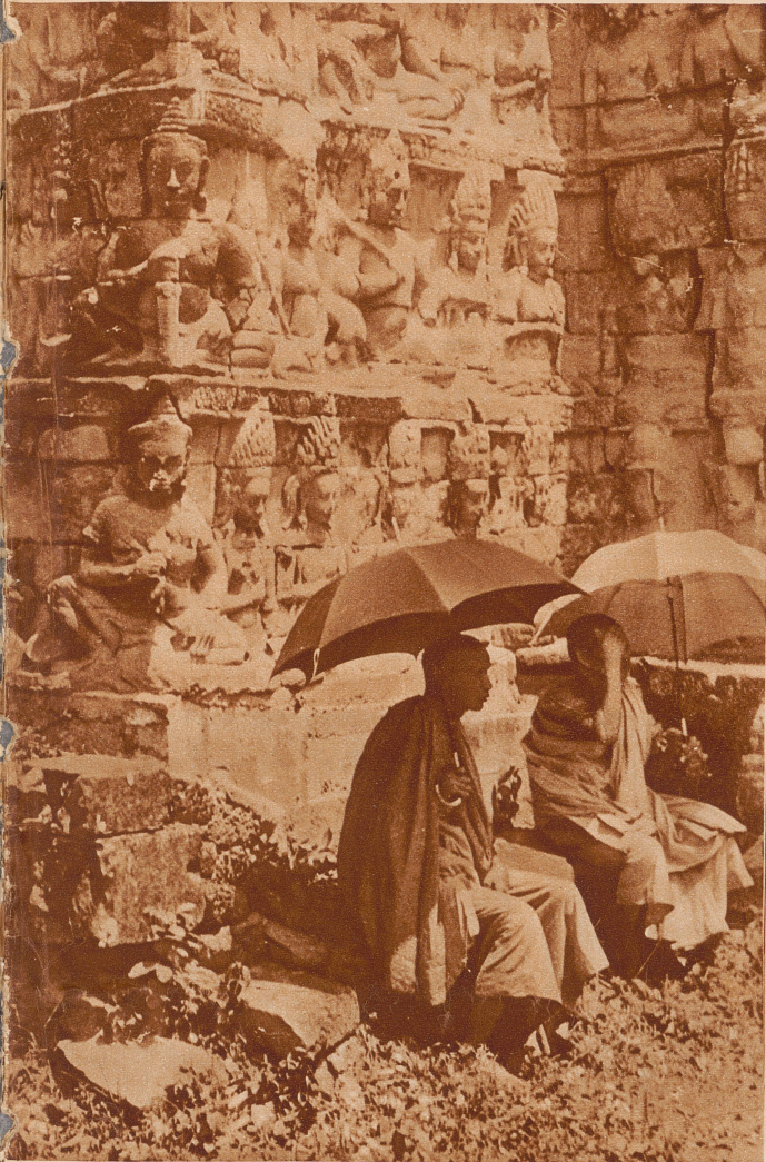
Angkor-Thom. Sehr gut erhaltene Bas-Reliefs an der einstigen Terrasse des Königs. Davor sitzen zwei buddhistische Priester