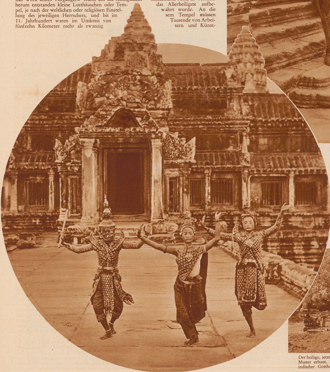
Links: Tanzepisode im Tempel von Angkor-Wat. In den farbigen Kostümen aus vergangener Zeit, mit graziösen Hand- und Fußbewegungen, tanzen die Kambodschaner-Frauen im wiedererstandenen Tempel Episoden aus der alten Mythologie