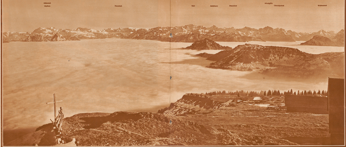
Der Nebelsee. Bild von Rigi-Kulm nach Südosten