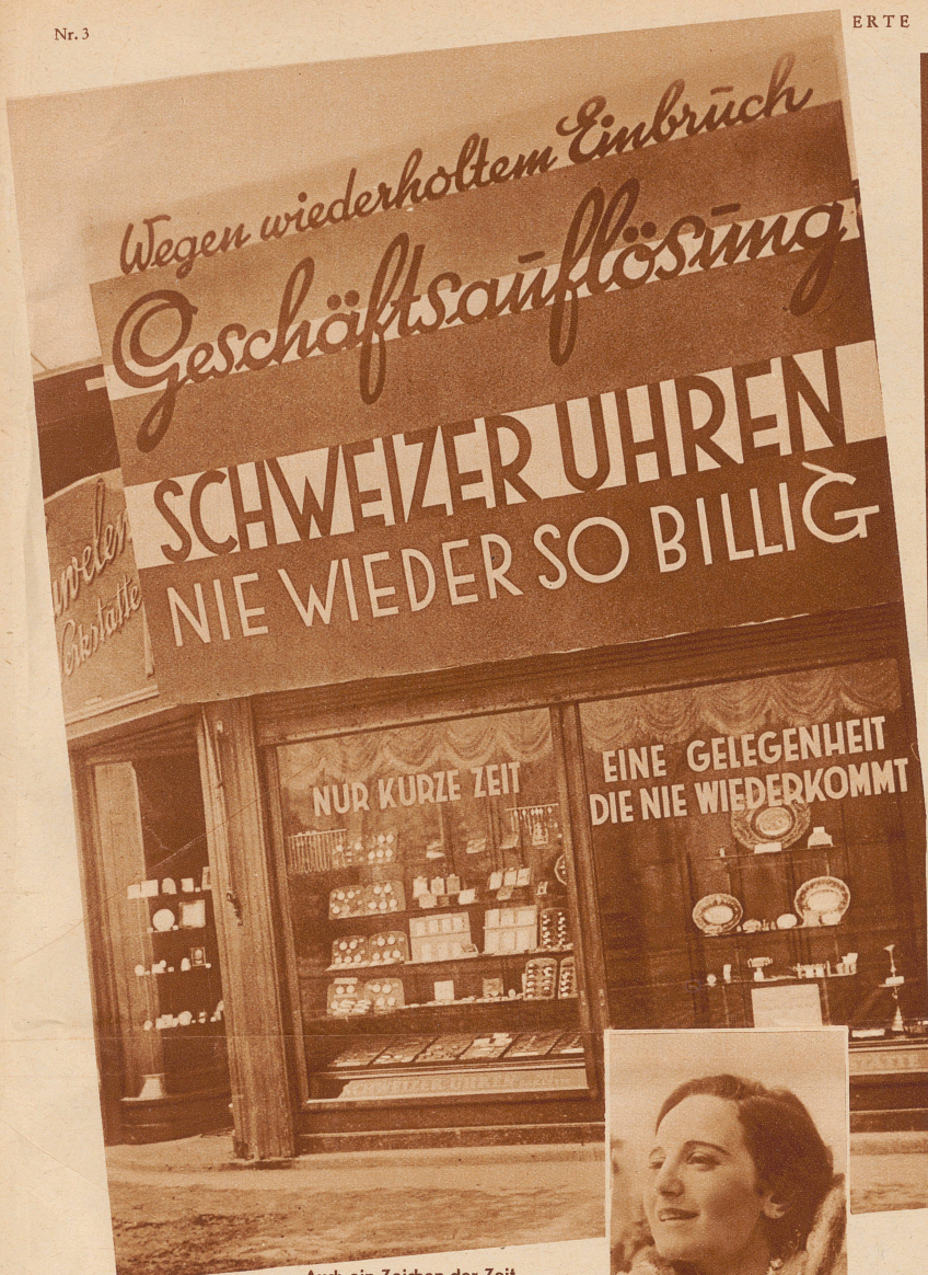
Auch ein Zeichen der Zeit.

Bei einem Wiener Juwelier wird eingebrochen und wieder eingebrochen und nochmals eingebrochen. Dem verängstigten Geschäftsinhaber verleiht die Anziehungskraft seiner Ware. Er rafft sich zu einer letzten Propagandatafel auf und begründet, nach dem Grundsatz «Wahrheit in der Reklame», die Geschäftsauflösung mit dem Hinweis auf die geschehenen Einbrüche