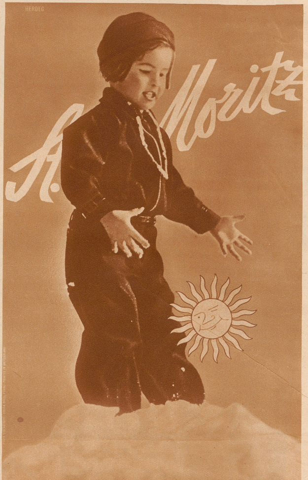
Plakat von Herdeg