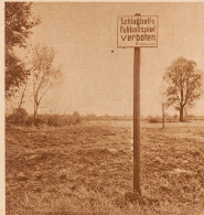
Zwei weitere Verbotstafeln auf dem Tägermoosgebiet als Zeugen der eigentümlichen Grenzverhältnisse.

DEUTSCHE VERBOTSTAFELN AUF SCHWEIZERBODEN