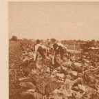
Das Tägermoos ist ein sehr fruchtbares Stück Land. Gute Gemüsegärten dehnen sich in breiten Streifen über das Feld.