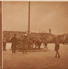
Wenn die Eisenbahn im Töbeli (drüben gegen die Tägermoos) im Bereich ist, dann auf dem Eingangsgebäude der Schweizerflurhüter neben der deutschen Fabrik. Der Kanonier-Verein hat die Rechte, von der Konstanz Stadtverwaltung für den Bahnhofsgebäude Gebühre zu verlangen. Er hat es aber nicht, weil dieser Sportverband immer ein Unfallschaden ist.