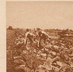
Das Tägermoos ist ein sehr fruchtbares Stück Land. Gute Gemüsegärten dehnen sich in breiten Streifen über das Feld.