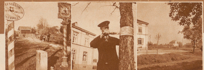
Die Grenzbachstraße, die von Zollhaus Tägerwilen nach Konstanz führt, liegt zum Teil auf schweizerischem, zum Teil auf deutschem Boden. Die weiß markierte Linie zeigt, wo das Straßchen von der Grenze über den See führt.