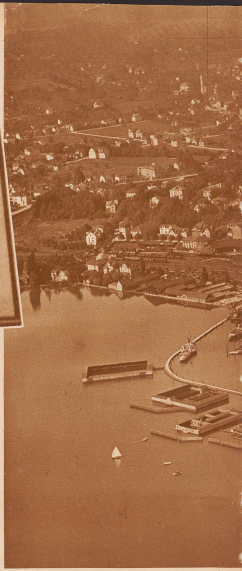
Blick vom Flugzeug auf Konstanz, Kreuzlingen, Töbeli und Tägermoos zu Tägerwilen. Das Töbeli gehört zur Gemeinde

Das Tägermoos ist nicht ganz eine landschaftliche Kette. Einen guten Einblick in dessen Wesen verschafft man sich auf der Landstraße, die vom Tägerwilen-Bahnhof nach Konstanz führt und die als Zufahrtsstraße zur Meerburger Fabrik besondere Bedeutung gewinnt. Ungeschickterweise geraten in Tägerwilen auf diese Straße auch viele Automobilisten, die gar nicht nach Konstanz fahren wollen und dann im Täger-