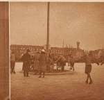
Wenn die Eisenbahn im Töbeli (drüben gegen die Tägerwilen) im Bereich ist, dann ist dem Eingangsgebäude der Schweizerzettel neben der deutschen Fahne. Der Kanonier-Verein hat die Rechte, von der Konstanz Stadtverwaltung für den Bahnhofsgebäude Gebühre zu verlangen. Er hat es aber nicht, weil dieser Sportverein immer ein Unfallschaden ist.