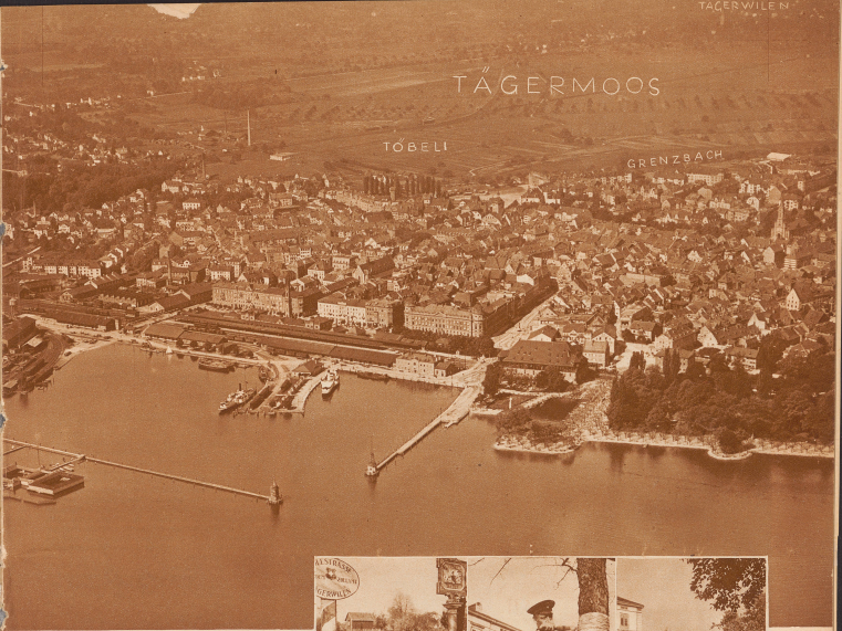
und Tägermoos. Eine im Hintergrund die thurgauische Kreuzlingen, das Tägermoos zu Tägerwilen. (Aus: A. M.)