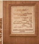
Die Stadt Konstanz betreibt auf dem im Kreuzlingen geborenen Töbeli ein Eisfeld. Der Eintritt mußte früher in Pfennigen entrichtet werden. Heute wird auch der Schweizerzettel angenommen.