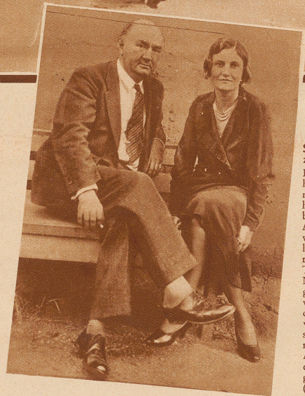
Schönheitskönigin zum Tode verurteilt. Die ehemalige Schönheitskönigin von Colorado (U. S. A.) Ruth Judd hat im Jahre 1931 ihre beiden Freundinnen Agnes Le Roy und Hedwig Samuelson meuchlings erschossen. Das Gericht verurteilte sie zum Tode durch den Strang. Nachdem ein Gnaden- gesuch der Mörderin verworfen worden ist, soll das Urteil am 17. Februar vollstreckt werden. Unser Bild zeigt Ruth Judd mit ihrem Gatten, dem Arzt Dr. Judd während eines Besuches im Staatsgefängnis von Florence (Arizona)