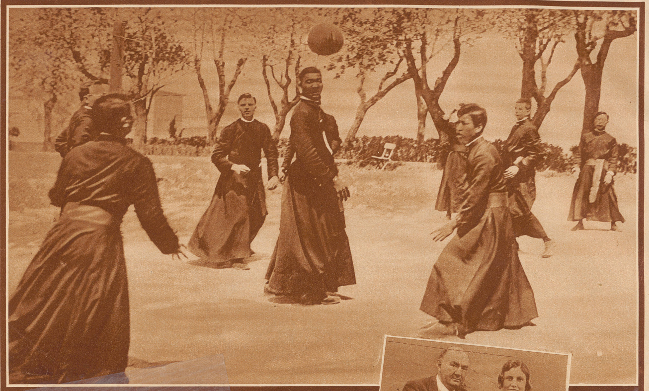
Kirche und Sport. Ausländische Studenten der Gregorianischen Universität in Rom – darunter Neger und Japaner – beim Fußballspiel