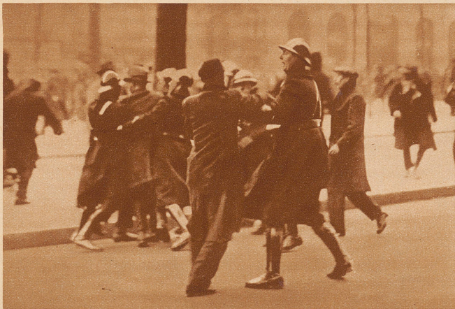
DEMONSTRANTEN: Die Pariser Polizei bemüht sich, auf der Avenue de la Grand Armée einen Demonstrationszug gegen die landwirtschaftliche Politik der Regierung zu sprengen