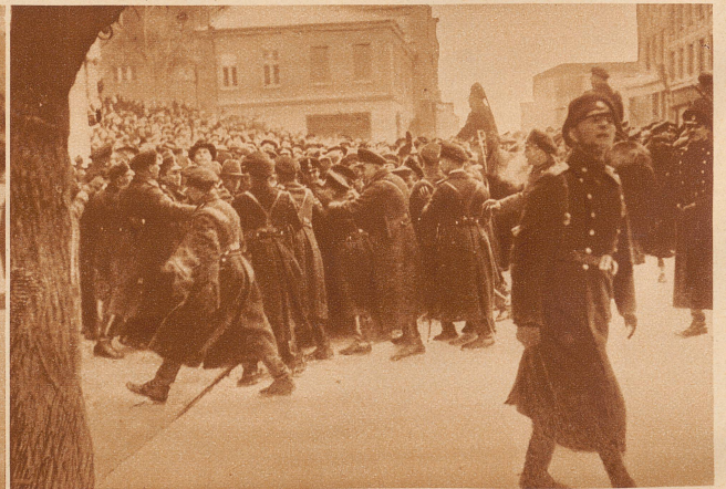
BEGEISTERTE: Die bulgarische Königin hat eine Tochter geboren: die Polizei von Sofia hält die begeisterte Menge in Schach, die sich nach der freudigen Kunde vor dem Königspalast drängt