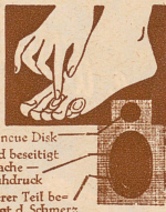
Der neue Disk-Rand beseitigt Ursache — Schußdruck Innerer Teil beseitigt d. Schmerz

Der äußere Rand des Pflasters schützt vor Druck und Reibung, während die luftdichte Abschlößung und das neue «Disk»-Scheibchen die Hornhaut erweicht, so daß sie leicht entfernbar ist. In Größen für Hühneraugen, Hornhaut, Ballen und weichen Hühneraugen zwischen den Zehen hergestellt. Fr. 1.50 per Schachtel jeder Größe.