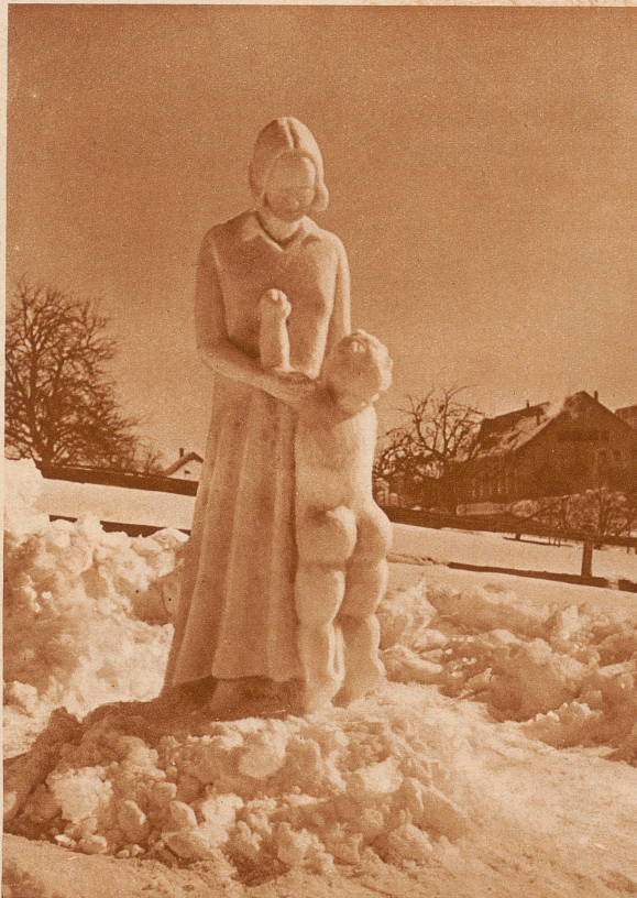
«Die Schwester mit dem kleinen Bruder»

«Wer's zerschlägt, bezahlt's!» unterbrach Selenginski lachend. «Schießt du hinein, Hundesohn, so mußt du berappen.»