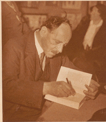
Jakob Wassermann sechzigjährig

Thorleif war entsetzt. Was hatte sie vor? Das war nicht nur absurd, das war einfach unsinnig. Farell stand also hinter diesen wahnsinnigen Plänen.