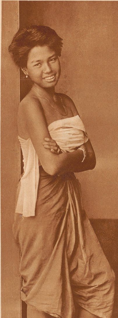
JUNGE SIAMESIN AUS BANGKOK