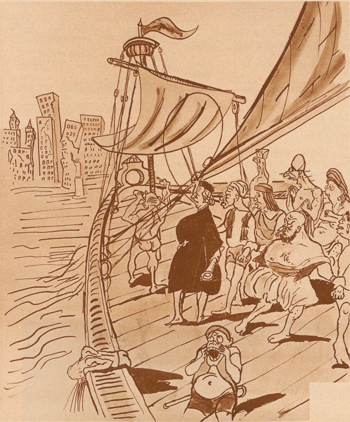
Christof Kolumbus heute: «Nei, da gömmer lieber wieder!»