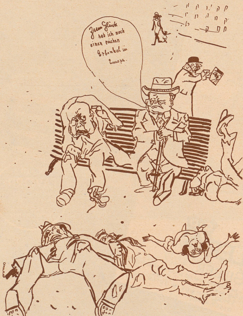
Der Onkel in der alten Welt soll helfen