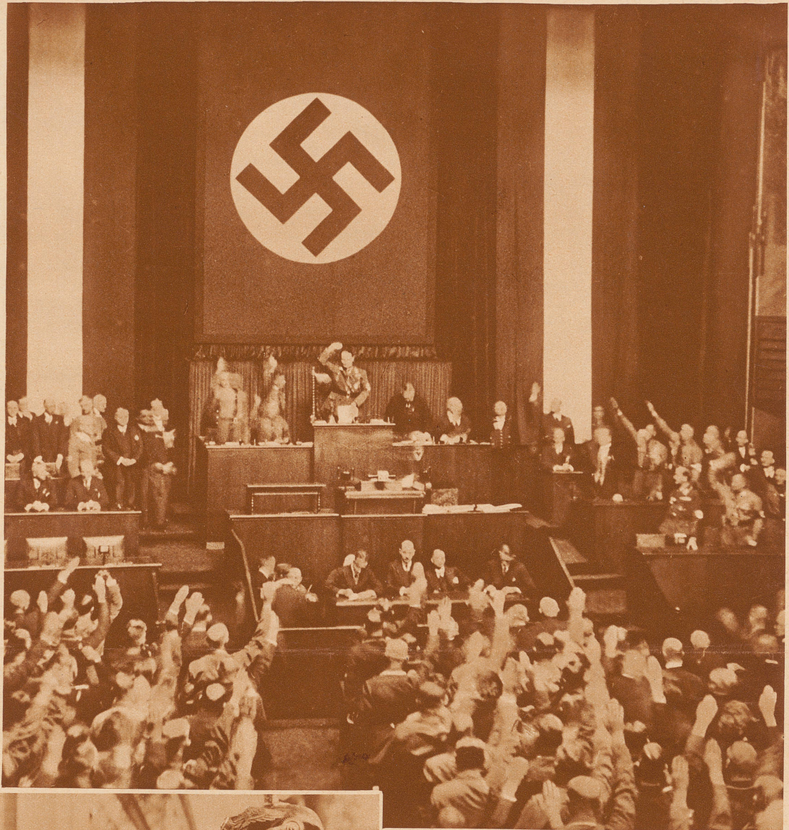
Die Sitzung in der Kroll-Oper in Berlin. Der Präsident Goering und die nationalsozialistische Fraktion beim Hitlergruß