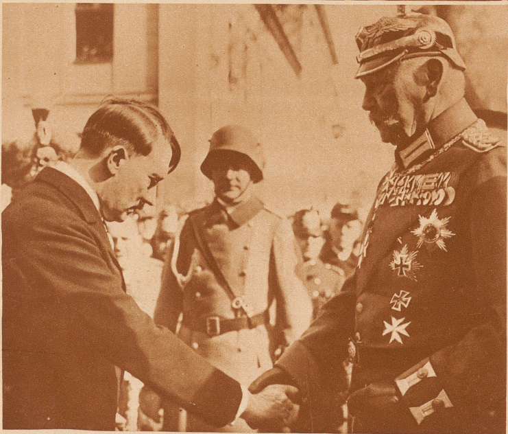
Der Reichskanzler Hitler und der Reichspräsident Hindenburg bei der Parade in Potsdam, welche auf die feierliche Reichstagsöffnung folgte