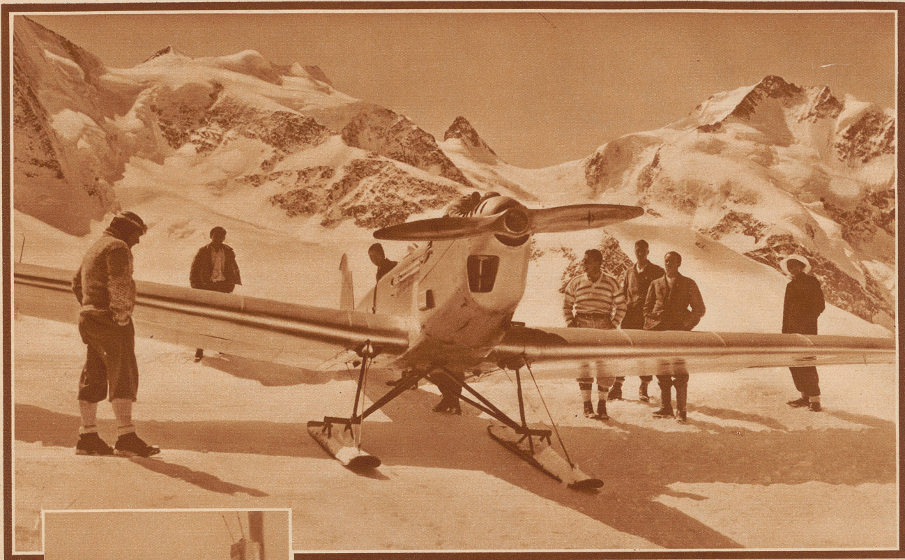
Glatte Landung im Hochgebirge. Dem bekannten deutschen Kunstflieger Udet, der sich augenblicklich in Pontresina aufhält, gelang vergangene Woche eine Flugzeuglandung auf 2977 Meter Höhe neben der Diavolezza-Hütte. - Die auf Skiern montierte Maschine auf dem Gletscher, links Udet, im Hintergrund Bella Vista, Crast-Agüzza und Piz Bernina