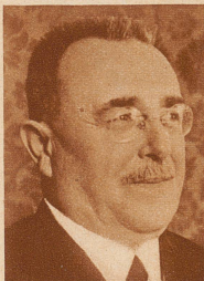
Dr. h. c. E. Buomberger Chefredaktor der «Neuen Zürcher Nachrichten» wurde an Stelle des verstorbenen Polizeivorstandes U. Ribl in den Staderrat von Zürich gewählt

In der neuerbauten, ausgedehnten Markthalle von Burgdorf fand vom 29. März bis 2. April die dritte schweizerische Ausstellung landwirtschaftlicher Maschinen und Geräte statt. An der Ausstellung beteiligten sich 96 schweizerische Maschinenfabrikanten und -Händler mit über 800 Maschinen. Bild: Bundesrat Minger beim Gang durch die Ausstellung