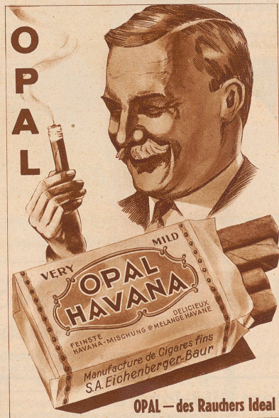
OPAL — des Rauchers Ideal