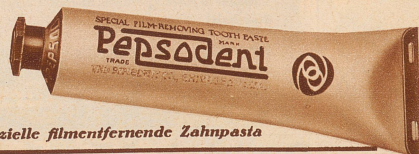
Die spezielle filmentfernende Zahnpasta

Verlangen Sie ein Gratismuster von O. Brassart Pharmaceutica A.-G., Zürich, Stampfenbadstraße 75