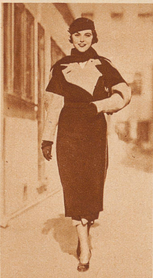
Vom kleinen Reklame-Modell zum großen Filmstar, Margaret Mc Gonnell, der neue Star der Metro-Goldwyn-Mayer, die vor kurzem noch schlecht-bezahltes Modell für Zahnpasta- und Mode-Inserte war