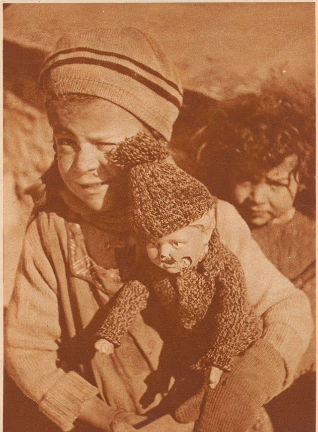
Wer übers Land geht, vergesse vor lauter Wiesen, Bäumen, Bächen und Sträuchern den Menschen nicht, der hier wohnt. Der Photograph hat im Hausertal Bekanntschaft gemacht mit einer defekten Puppe und ihrer fürsorglichen Besitzerin