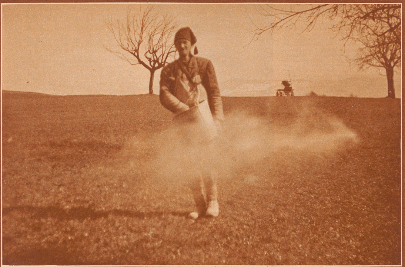
Dem Wachsen und Sprießen der Natur nachhelfend, schreitet der Bauersmann bedächtig über der Wiese und streut, in eine Wolke gehüllt, den Kunstdünger