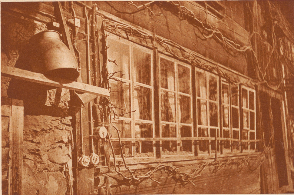
Von Sihlbrugg führt der Weg durch Büchenlaub und Staudengewirr, unter blauem Himmel und Vogelgezwitscher zum Schweikhof. Das ist ein altes Gehöft mit langen glitzernden Fensterreihen, die heiter ins Tal blicken