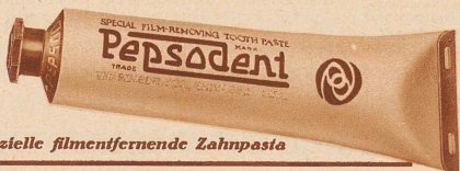
Die spezielle filmentfernende Zahnpasta

Verlangen Sie ein Gratismuster von O. Brassart Pharmaceutica A.-G., Zürich, Stampfenbadstraße 75