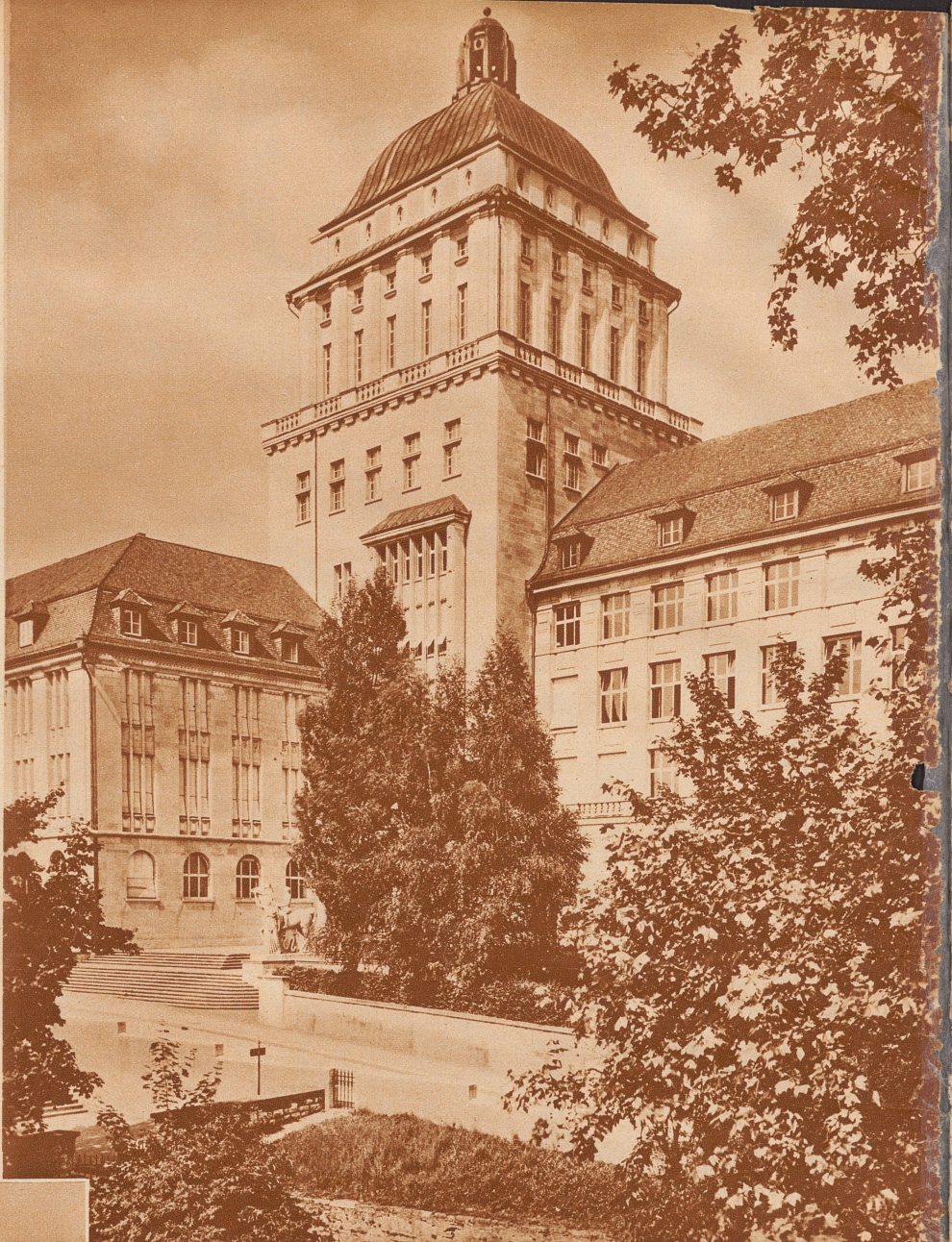
Die Universität Zürich von Südwesten. Erbaut in den Jahren 1910—1914 nach den Plänen von Prof. Karl Moser, eingeweiht am 8. April 1914

Dr. jur., theol., nat. ök. und rer. pol., geb. 24. Jan. 1867. Er dozierte an den Universitäten Zürich, Basel, Tübingen, Heidelberg und wurde 1915 als Ordinarius für öffentliches Recht und Kirchenrecht an die Universität Zürich berufen. Seine Arbeiten über das deutsche Verwaltungsrecht sowie seine kirchenrechtlichen Monographien schufen ihm einen bedeutenden Namen. Seine Vorlesungen zeichnen sich durch ihre vollendete Form aus Aufnahme Staub