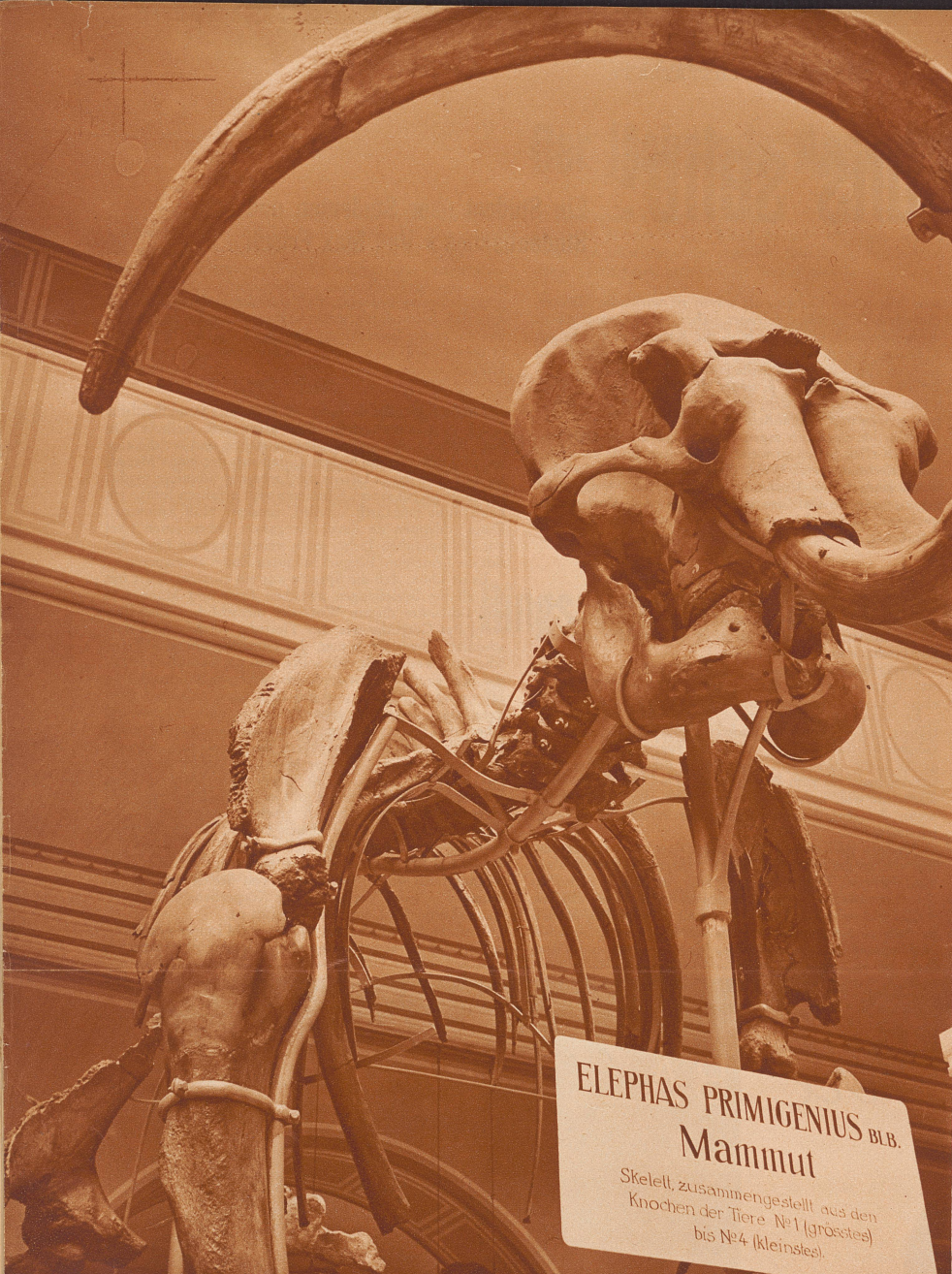
In der zoologischen Sammlung der Universität: Mammutskelett

Denn auf einer heutigen Universität arbeiten wir aneinander vorbei: wie auf dem Turm zu Babel.