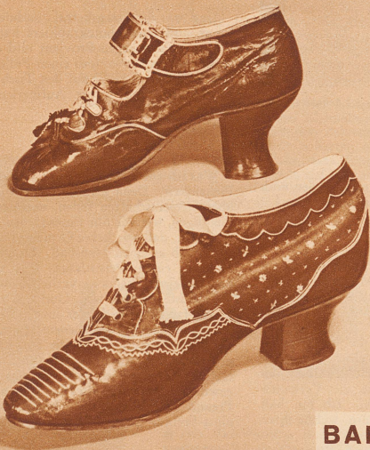
BALLY MODELLE 19. JAHRH.