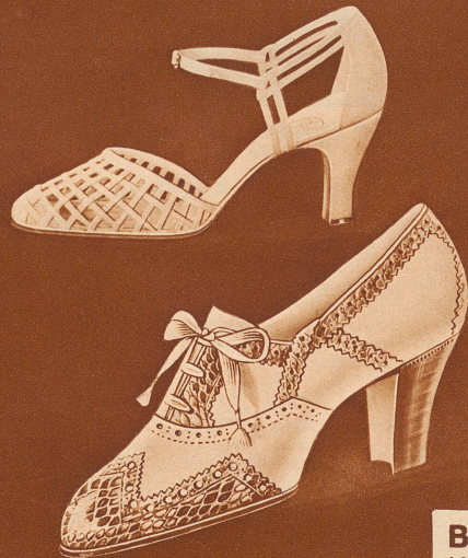
BALLY MODELLE 20. JAHRH.