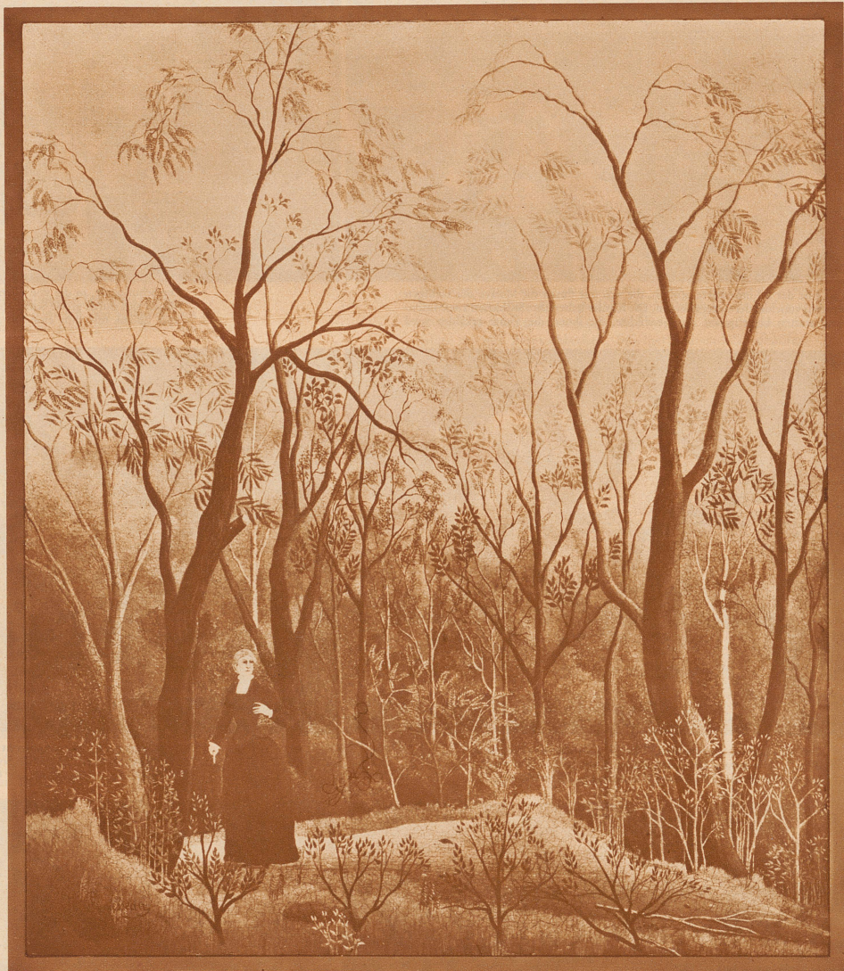
Henri Rousseau «Der Spaziergang»

Die immer noch steigende Wirtschaftsnot der meisten europäischen Staaten, hat unser Land wenigstens ein Gutes beschert: in normalen Zeiten hätten wir wohl nie Gelegenheit bekommen, innerhalb einer so kurzen Zeitspanne die Hauptwerke der modernen Malerei in großen internationalen Ausstellungen kennenzulernen. Allen ist noch die große Zürcher Picasso-Ausstellung in Erinnerung, die das gesamte Schaffen dieses Meisters vorgeführt hat und so erst einen Ueberblick über die chronologische Entwicklung dieses heiß umstrittenen Künstlers ermöglichte. Ihr folgten kurz darauf die Ausstellungen Henri Rousseau und George Braque in Basel, die Ausstellungen Juan Gris und Fernand Léger in Zürich und E. L. Kirchner in Bern. Auf diese Weise konnte sich jeder mit den Hauptströmungen der modernsten Malerei auf Grund eigener Anschauung auseinandersetzen und sich für oder wider entscheiden.