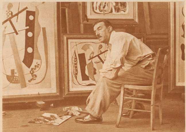
Fernand Léger in seinem Pariser Atelier