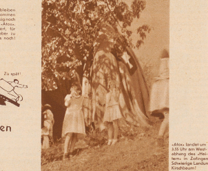
«Atox» landet um 3.50 Uhr am West-Abhang des «Meisterschwanden» in Zofingen, (Schweizer Landung) Ende!

Victor de Beauclair landet einige Minuten vor 4 Uhr westlich von Belpach auf dem rechten Ufer. Ein kleiner Hainweg ist schnell zur Stelle, halt sich den roten Wimpel.