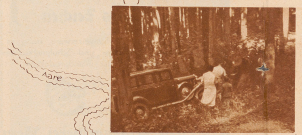
Lizbegg! Wo ist «Atox»? Nicht zu sehen, Wacht! Götter! Lebn! Wo stehen stehen! Fenne wohl «Atox»? Wo ist ein Baum im Park (Lind) - Kanten schärfen um die Erde die die Welt hat! Es ist die drei Alle Ballons gerade! Aus Traurige Helmut!