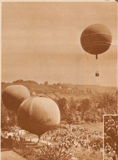
Die drei Ballons am Startplatz in Schönen. Die Frühlingssonne dufft, und es regnet nach. Das wie in Kaffees Küche, wenn die Fotos schlecht geschossen ist.