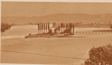
Blick auf die kleine Insel Werd am Ausfluß des Rheins aus dem Untersee. Rechts die Verbindungsbrücke mit dem thurgauischen Orte Eschenz. Die Insel und das einzige Wohnhaus darauf, das gegenwärtig vom früheren Erzbischof von Bukarest, Eminenz Netzhammer, bewohnt wird, sind Eigentum des Klosters Einsiedeln

Sensationelle Funde bei den neuesten Ausgrabungen auf der Insel Werd