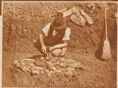
Eine neulich ausgegrabene Feuerstelle einer Pfahlbauerwohnung. 3000 Jahre lang war sie unter Schutt und Erde verborgen, jetzt wird sie ganz sorgfältig und säuberlich freigelegt und geputzt