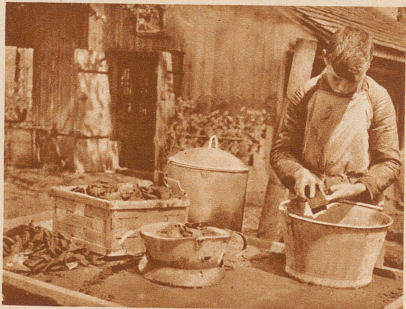
Jedes ausgehobene Stück und jeder Scherben wird sofort mit warmem Wasser gereinigt