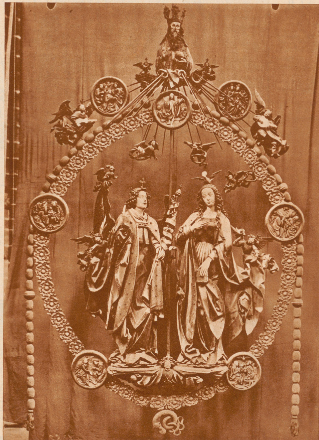
«Der Englische Gruß»